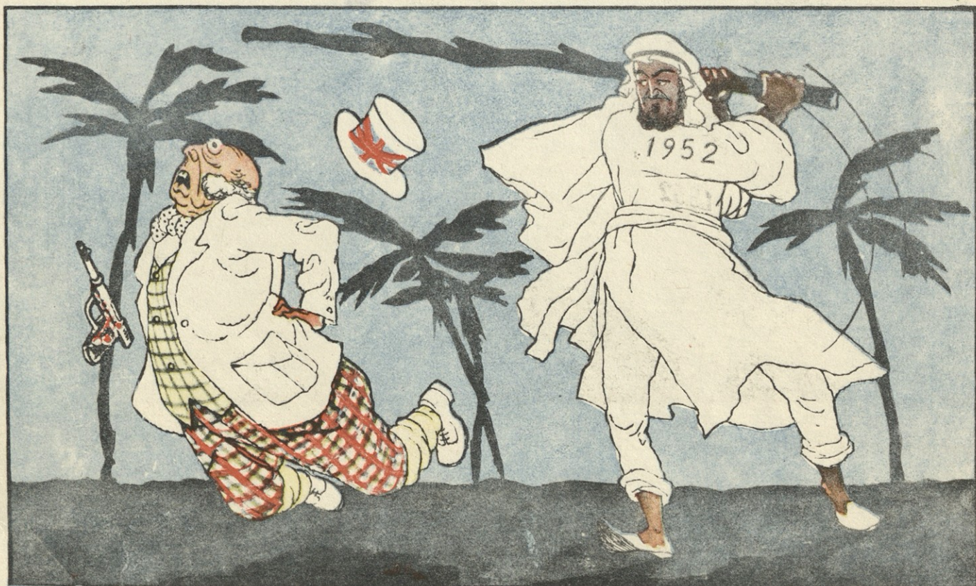
ჯონ ბულის ახალი...ვაიბე ნელი!