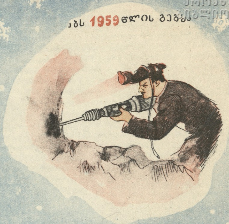
1959 წლის გაზგა