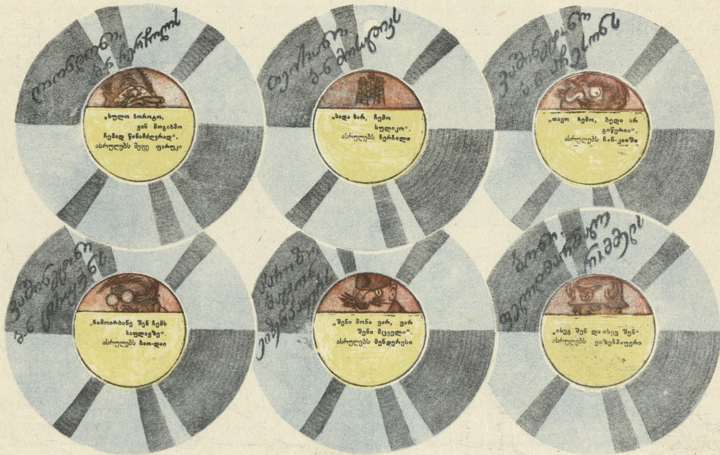
ნახ. გ. ლომიძისა

ახალ, 1952 წლის შეხვედრასთან დაკავშირებით, სხვადასხვა კაპიტალიზტურ სახელმწიფოთა წარმომადგენლებმა შეასრულეს საახალწლო სიმღერები. ეს სიმღერები ჩაიწერა ფირფიტებზე და მოხდა მათი გაცვლა-გამოცვლა სახელმწიფო მოღვაწეთა შორის. ვათავსებთ ამ ფირფიტების რამდენიმე ნიმუშს: