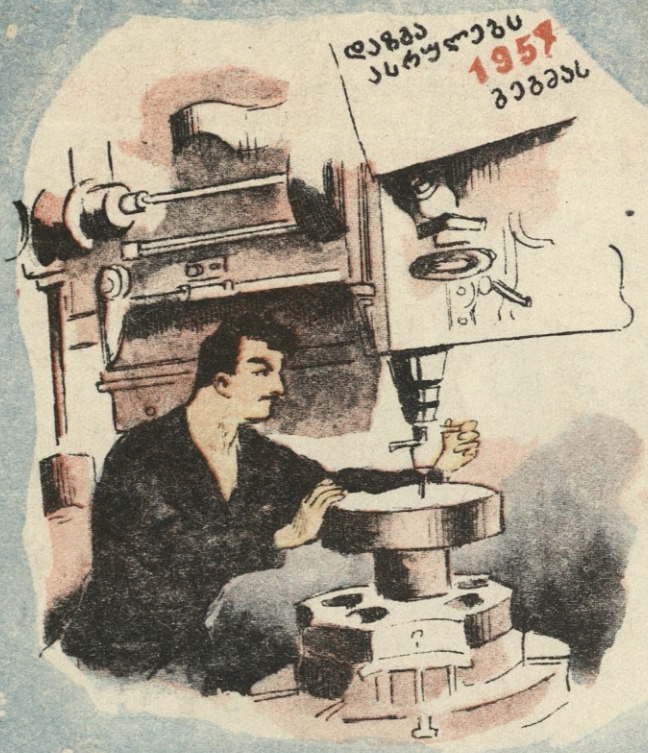
დაზგა ასრულავს 1957 გაზგას