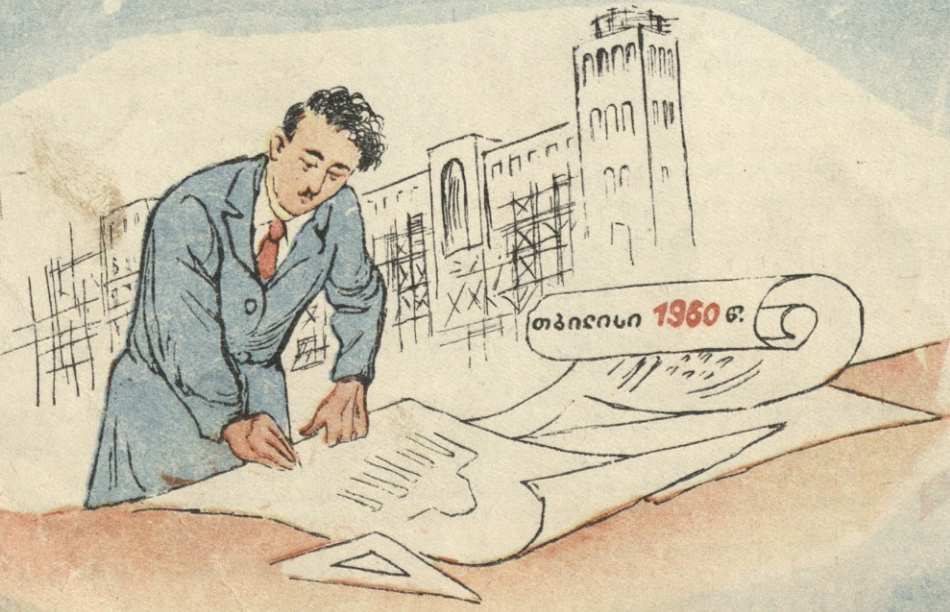
თბილისი 1960 წ.