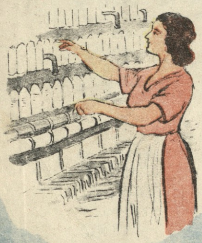
1954 წლის გაზგა