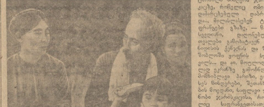
კადრი ფილმიდან „ვიეტნამი“.