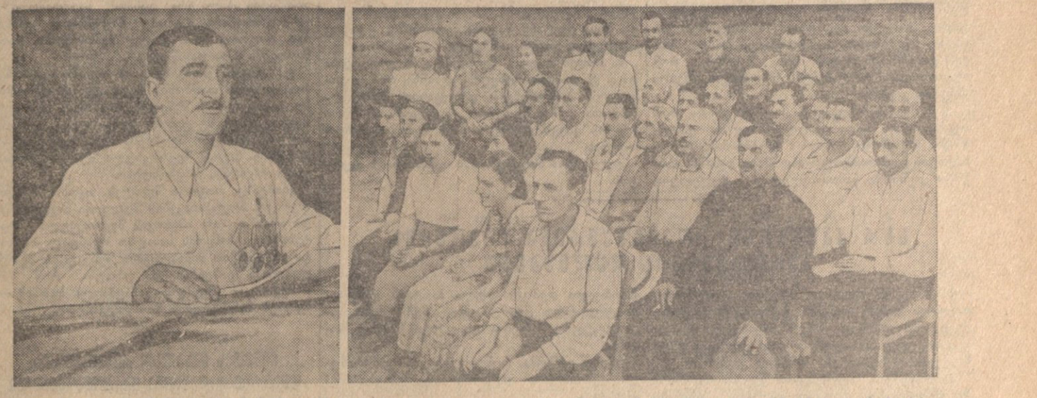
სოფელ ძიბოის „ახალგაზრდა კომუნისტი“ სახელობის კომუნისტურად მოწინავე გამოცდილებითაა შეხვედრისათვის საკავშირო სასოფლო-სამეურნეო გამოფენაზე შეიქმნილი გამოცდილების შესახებ.