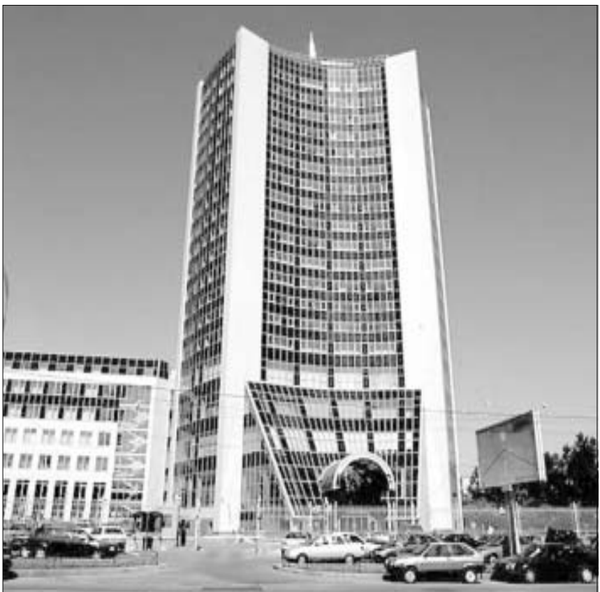
“იტერას” ოტელი მოსკოვში.

პანკისისგან განსხვავებით, აფხაზეთის ტერიტორიაზე სიტუაციის განმარტება უფრო მოსალოდნელია. თანაც, გაზინია, რა მიმართულებით განმარტდება სიტუაცია - იქნება ეს გალის რაიონი თუ საქართველოსთვის სტრატეგიული და ფსიქოლოგიური თვალსაზრისით უმნიშვნელოვანესი კოდორის ხეობა, სადაც ბოლო დროს ქართველებიც და აფხაზებიც სულ უფრო ხშირად ეთამაშებიან ცეცხლს.