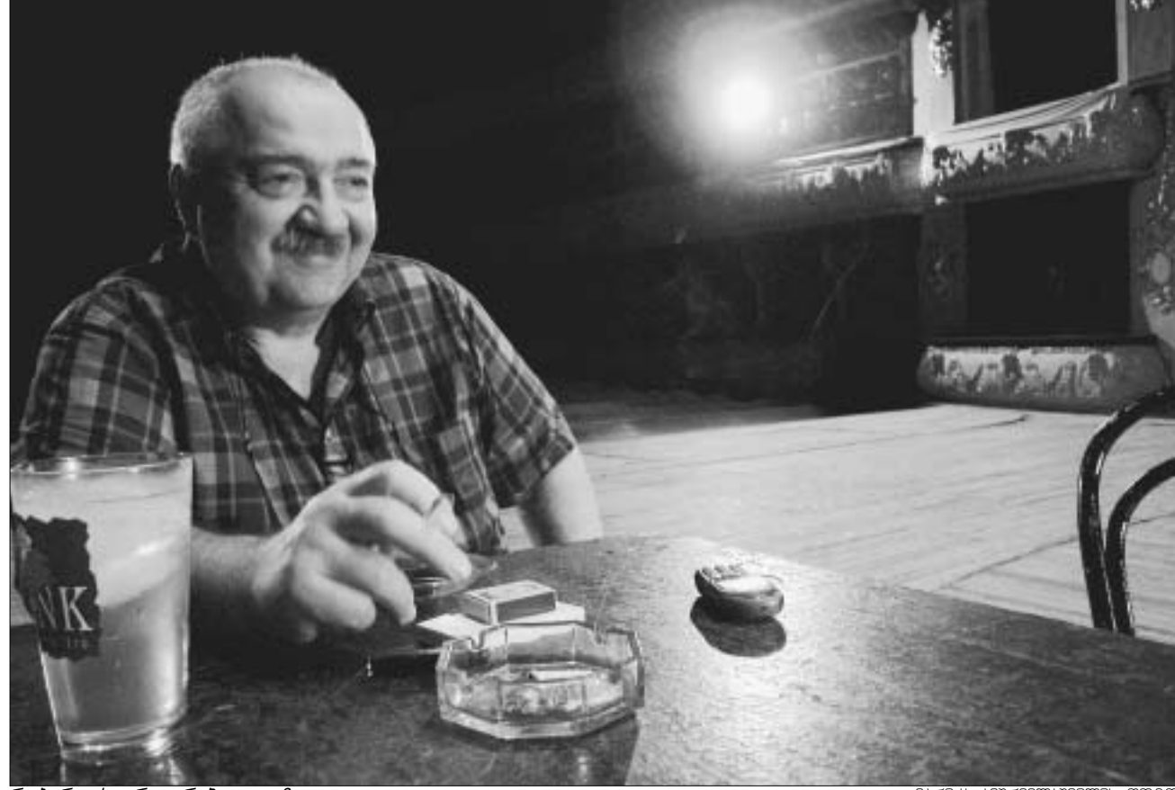
რობერტ სტურუა რეპეტიციისაზე