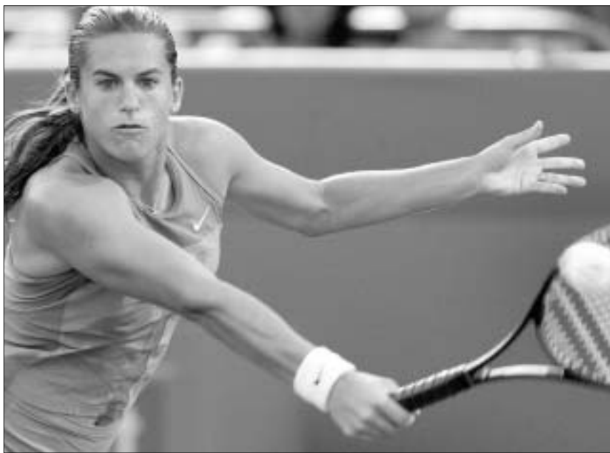
ამელი მორეზმო REUTERS

მონრეალი კანადა ქალები პარ- დი. საპრიზო ფონდი 1 224 000 დო- ლარი. შარშანდელი ჩემპიონი სერენა უილიამსი (აშშ). ნახევარფინალი. ჯენიფერ კაპრიატი (აშშ, 2) - ელენა დოკიჩი (ოუგოსლავია, 3) 7:6 (7:5), 4:0 - დოკიჩმა თამაში შეწყვი- ტა.