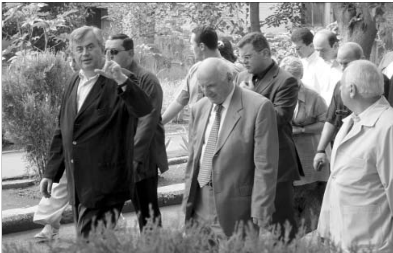
საქართველოს მთავრობის დელეგაცია

გუშინ სახელმწიფო მინისტრი "აზოტს" იმის გასაკვებად ეწვია, თუ რას ფიქრობენ იქ "იტერაზე", რო-