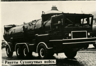
Ракеты Сухопутных войск.

Советский народ кровно заинтересован в сохранении мира, но агрессивная политика американских империалистов и реваншистов ФРГ создают угрозу безопасности на земле.