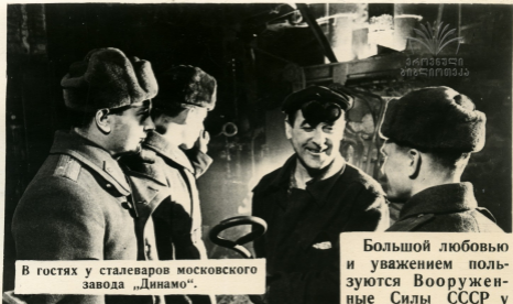
В гостях у сталеваров московского завода „Динамо“.

Большой любовью и уважением пользуются Вооруженные Силы СССР у всех советских людей. Общие интересы Коммунистического строительства, тесно объединяют в нашей стране трудящихся и воинов.