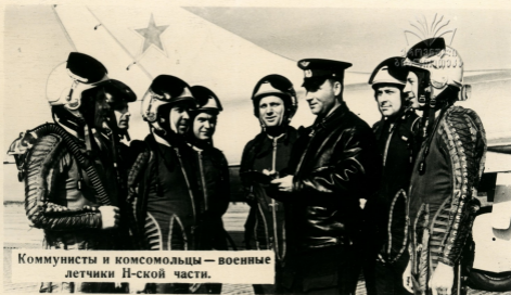
Коммунисты и комсомольцы — военные летчики Н-ской части.