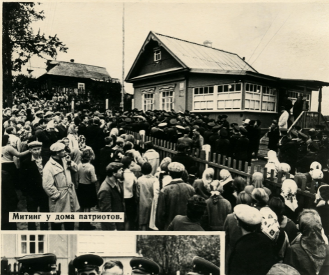
Митинг у дома патриотов.