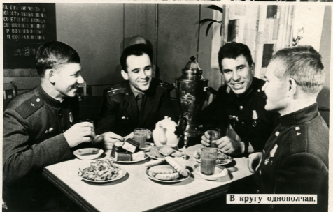
В кругу однополчан.

Легче служится солдату, когда в свободные от ратного труда минуты можно послушать любимые песни, побывать с товарищами в кино, посидеть в солдатской чайной.