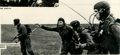
Разведчики-десантники на учениях.

29 марта 1966 года открывается XXIII съезд Коммунистической партии Советского Союза. Личный состав армии и флота включился в соревнование за достойную встречу съезда партии. В частях и на кораблях множатся ряды отличников учебы, классных специалистов. Лучшие из лучших воинов вступают в ряды КПСС.