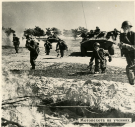
Мотопехота на учениях.

Лучший подарок XXIII съезду КПСС — высокая боевая готовность войск, отличная выучка и твердая дисциплина личного состава.