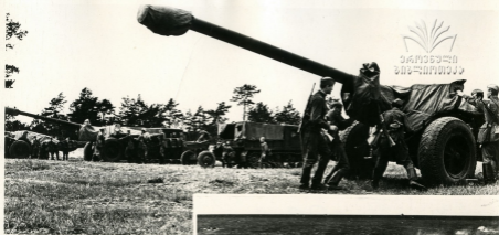
Артиллерийское подразделение готовится к маршу.

Наша армия постоянно пополняется новейшими танками, артиллерийскими орудиями и другой боевой техникой.