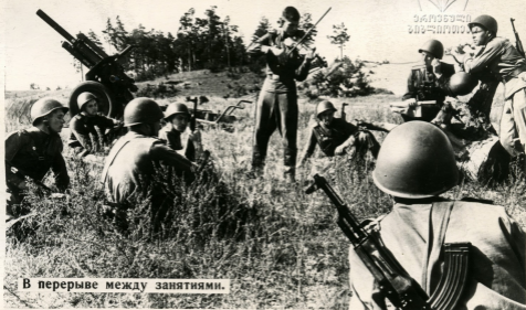
В перерыве между занятиями.