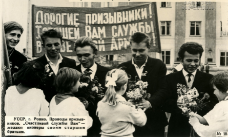
УССР, г. Ровно. Проводы призывников. «Счастливой службы Вам» — желают пионеры своим старшим братьям.

Торжественные проводы молодежи на службу в Советскую Армию стали ныне традицией. Многие предприятия, колхозы и совхозы поддерживают с воинами-земляками связь, ведут с ними переписку.