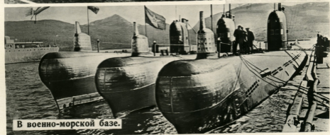
В военно-морской базе.

Советский народ кровно заинтересован в сохранении мира, но агрессивная политика американских империалистов и реваншистов ФРГ создают угрозу безопасности на земле.