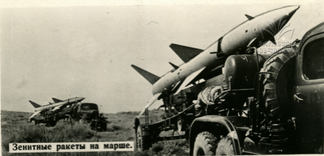
Зенитные ракеты на марше.