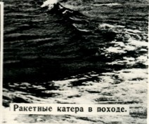
Ракетные катера в походе.