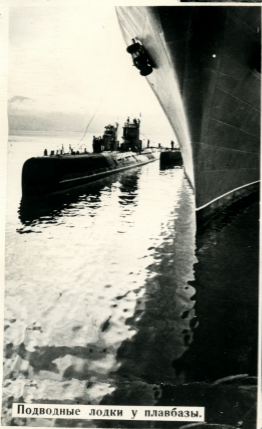
Подводные лодки у плавбазы.