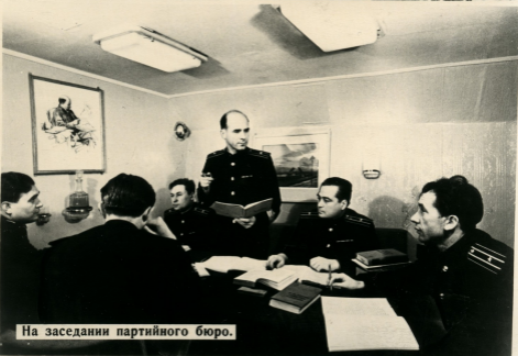
На заседании партийного бюро.

Личный состав армии и флота предан великому делу коммунизма. Боевой костяк армии составляют коммунисты и комсомольцы; 90 процентов офицеров Вооруженных Сил являются членами Коммунистической партии и ленинского комсомола.