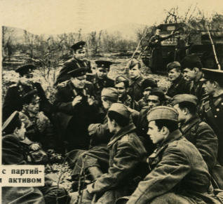
Беседа командира с партийно-комсомольским активом части.

Единоначалие в армии и на флоте обеспечивает твердость и гибкость в управлении войсками, четкую организованность и дисциплину, высокую личную ответственность командиров за боевую готовность, обучение и воспитание подчиненных.