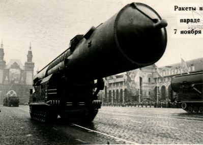
Ракеты на военном параде в Москве. 7 ноября 1965 года.