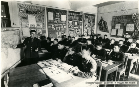
Политические занятия в подразделении.

Современный бой—самое большое испытание моральных и физических качеств воинов. Чем смертоноснее и разрушительнее оружие войны, тем крепче должно быть политико-моральное состояние и выносливость воинов.