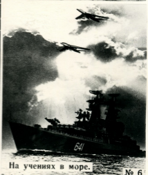
На учениях в море.