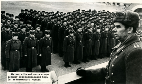
Митинг в Н-ской части в поддержку освободительной борьбы вьетнамского народа.

„Руки прочь от Вьетнама!“—вместе со всем народом заявляют советские воины. Они гневно осуждают агрессию американской военщины во Вьетнаме.