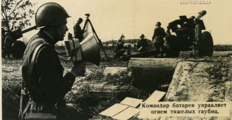
Командир батареи управляет огнем тяжелых гаубиц.

Единоначалие в армии и на флоте обеспечивает твердость и гибкость в управлении войсками, четкую организованность и дисциплину, высокую личную ответственность командиров за боевую готовность, обучение и воспитание подчиненных.