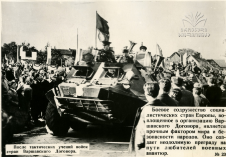
После тактических учений войск стран Варшавского Договора.

Боевое содружество социалистических стран Европы, воплощенное в организацию Варшавского Договора, является прочным фактором мира и безопасности народов. Оно создает неодолимую преграду на пути любителей военных авантур.