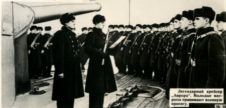
Легендарный крейсер „Аврора“. Молодые матросы принимают военную присягу.