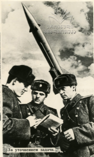
За уточнением задачи.

Лучший подарок XXIII съезду КПСС — высокая боевая готовность войск, отличная выучка и твердая дисциплина личного состава.