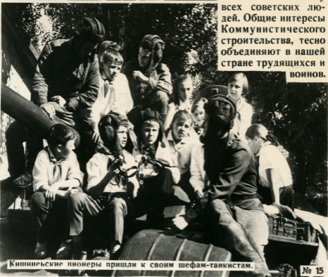
Кишиневские пионеры пришли к своим шефам-танкистам.

Большой любовью и уважением пользуются Вооруженные Силы СССР у всех советских людей. Общие интересы Коммунистического строительства, тесно объединяют в нашей стране трудящихся и воинов.