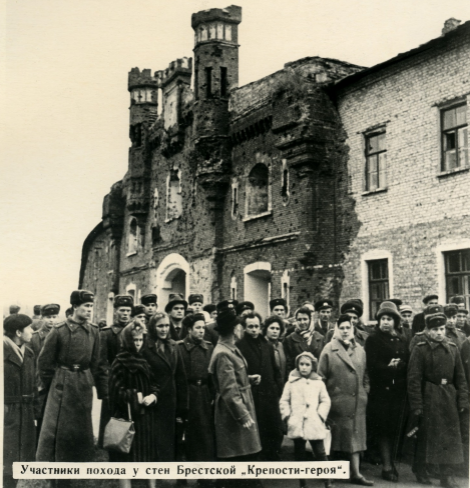
Участники похода у стен Брестской «Крепости-героя».

В 1965 году, когда вся страна праздновала 20-летие Победы над фашистской Германией, проводился Всесоюзный поход молодежи по местам героических битв Советской Армии. Три миллиона юношей и девушек прошли по этим местам, встречались с ветеранами и героями войны, привели в порядок тысячи братских могил, установили новые памятники и обелиски.