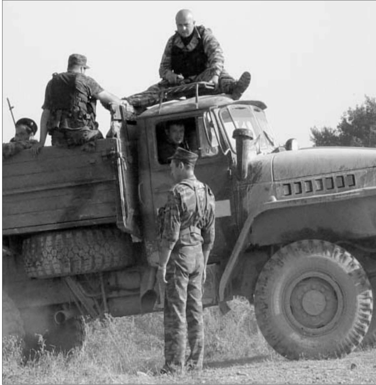
სამხვიდროების "დიდი გასერება"