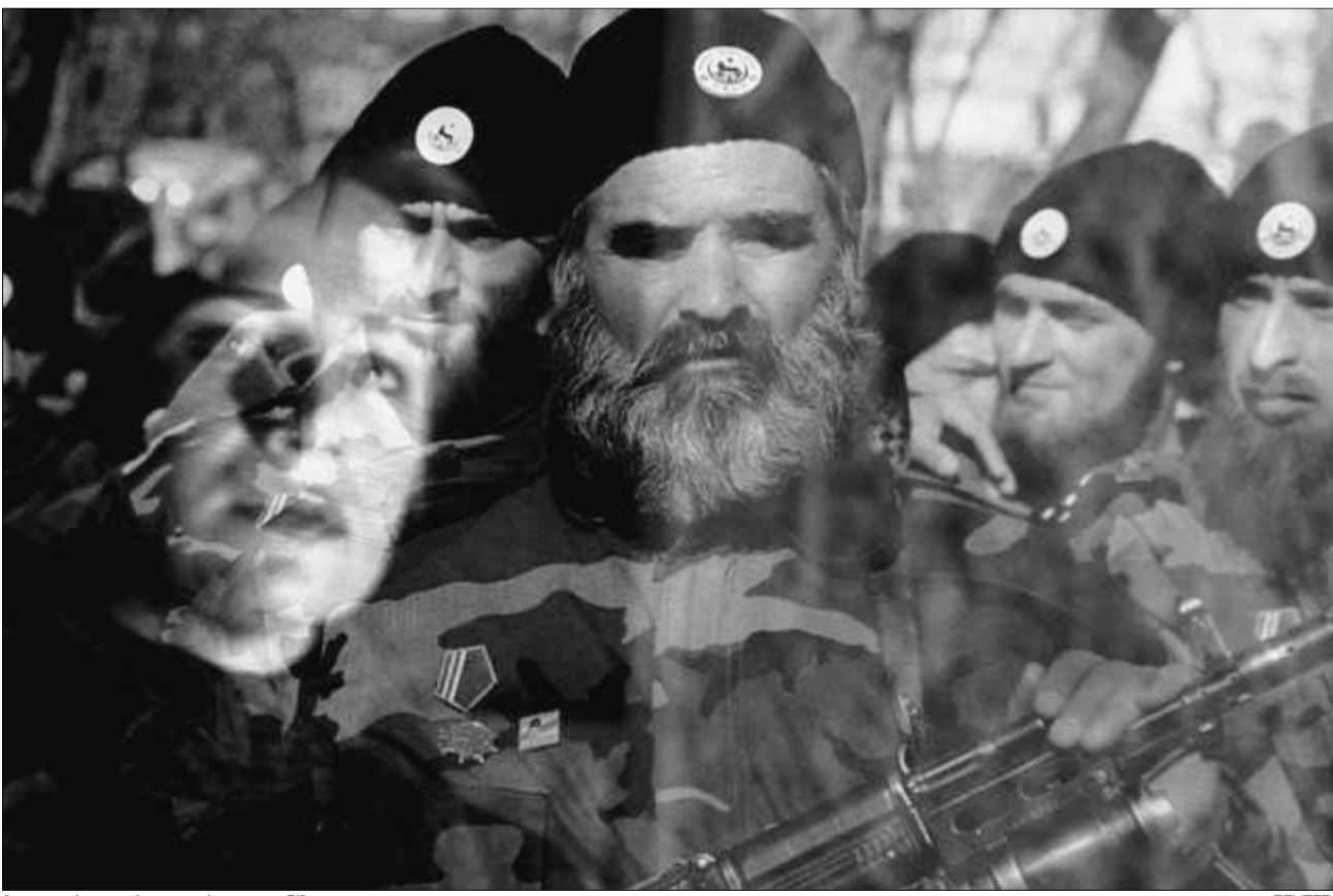
ყველს ვერ დაგვხვდებიან