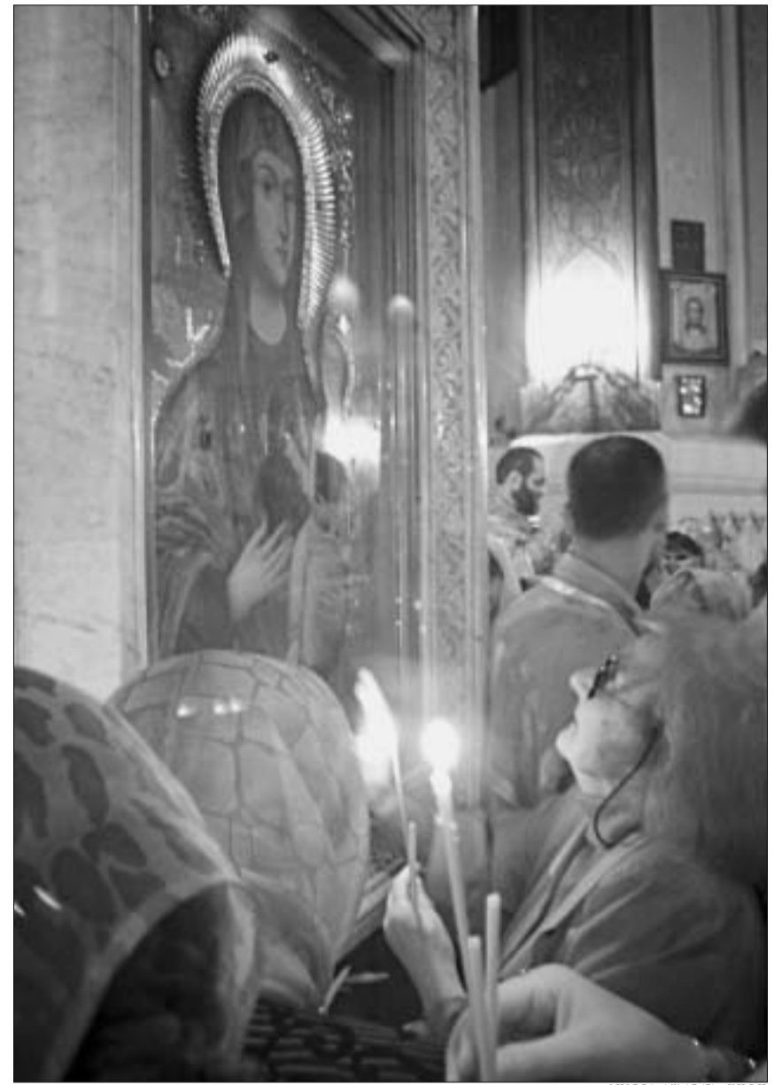
მარიამობის დღესასწაულზე, თბილისი