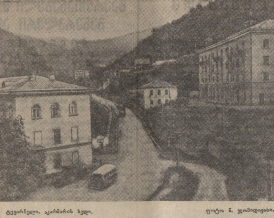
ტყვარჩილი. აკარმაზის ხედი.