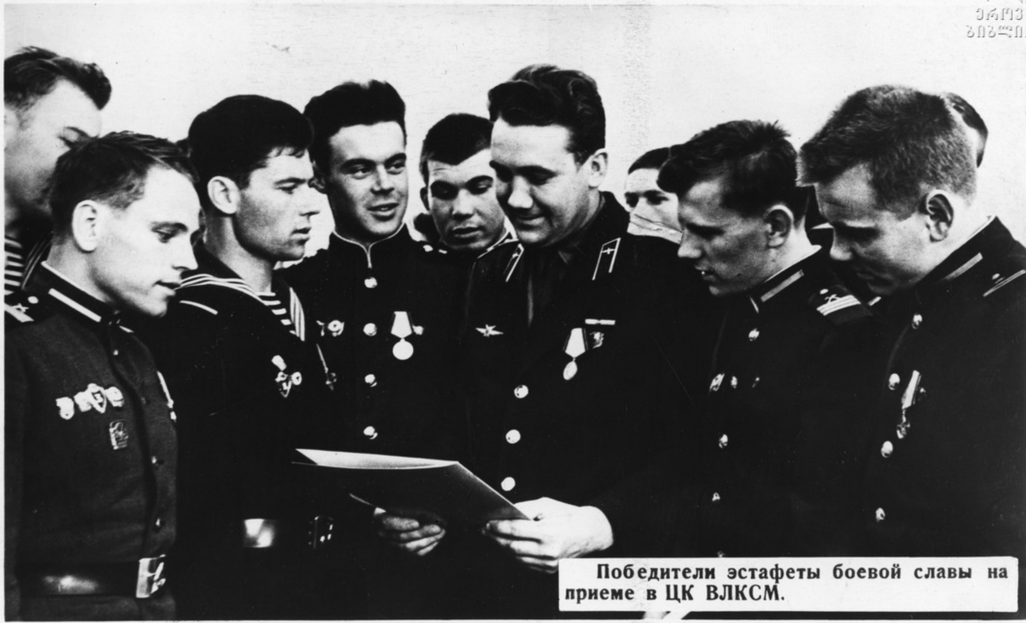
Победители эстафеты боевой славы на приеме в ЦК ВЛКСМ.

Много славных, патриотических дел на счету армейской и флотской молодежи. Комсомольские организации частей и кораблей являются надежными помощниками командиров в соревновании за высокие показатели в учебе. С большим успехом они провели эстафету боевой славы, способствовавшую повышению боевой готовности.