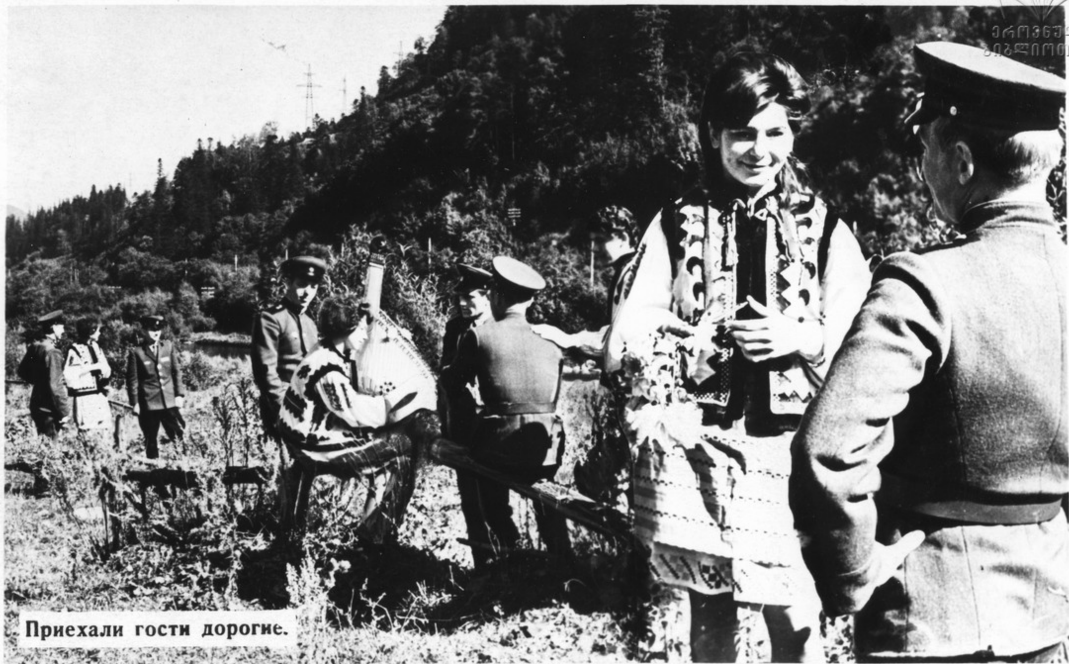
Приехали гости дорожные.

С каждым годом ширятся и крепнут связи армии и народа. Воины — желанные гости на предприятиях, в колхозах и совхозах. Совместные вечера, выступления коллективов художественной самодеятельности, походы и экскурсии по местам революционной и боевой славы стали доброй традицией.