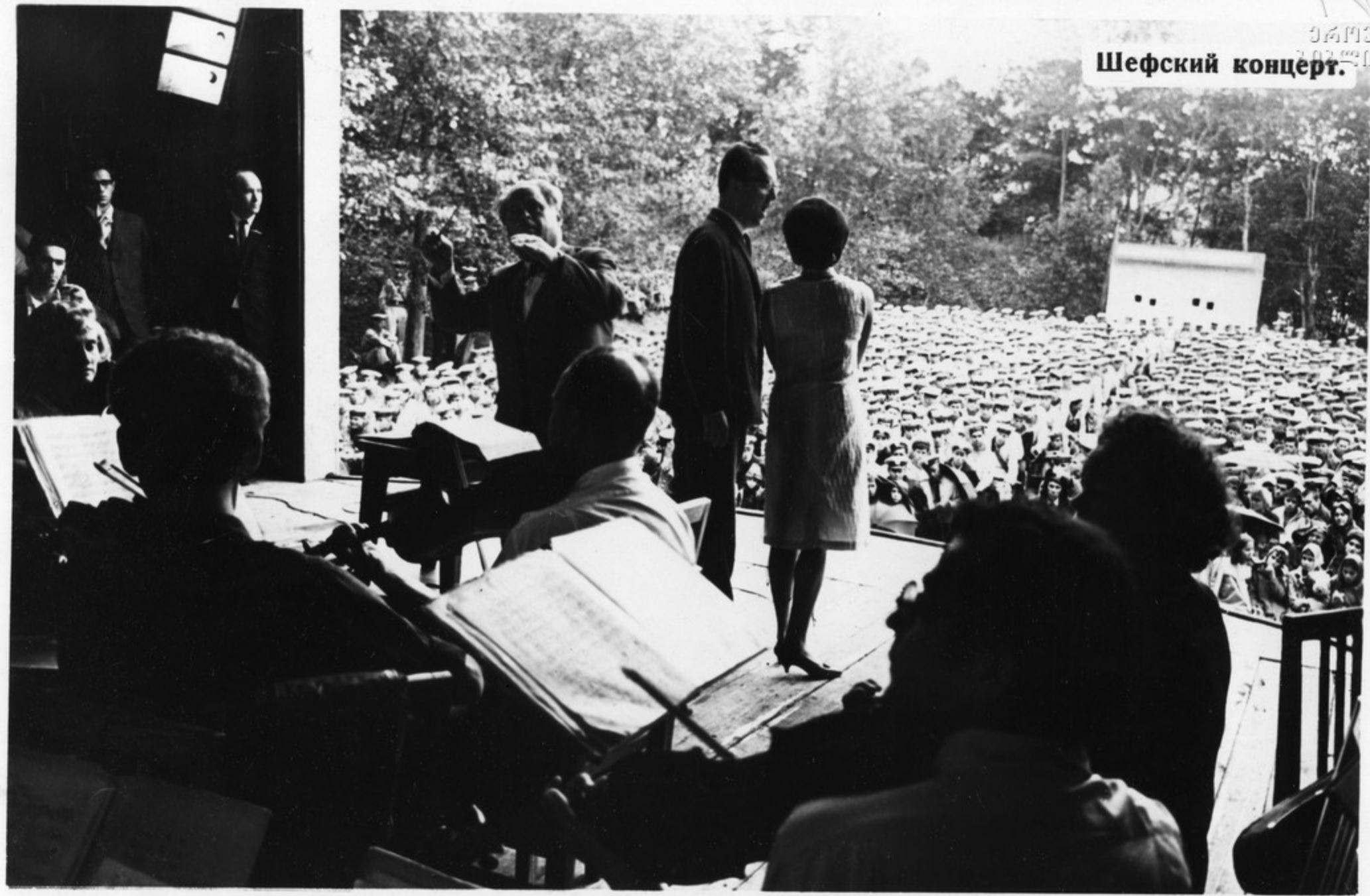
Крепкая дружба связывает деятелей литературы, искусства, науки с советскими воинами. Писатели и художники, артисты и ученые — частые гости во многих частях армии и флота.