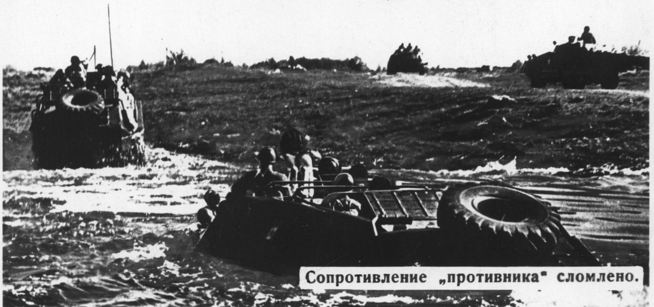
Сопrotивление „противника“ сломлено.

Овладеть искусством побеждать в современном бою сильного, технически оснащенного противника — не так просто. В напряженном ратном труде воины неустанно оттачивают мастерство, добиваются четкости и слаженности экипажей, расчетов, отделений. Подлинной школой боевой выучки остаются тактические занятия и учения, где воины учатся стремительно атаковать, преодолевать районы „ядерных“ ударов. Недаром говорят: „На учениях — как в бою!“