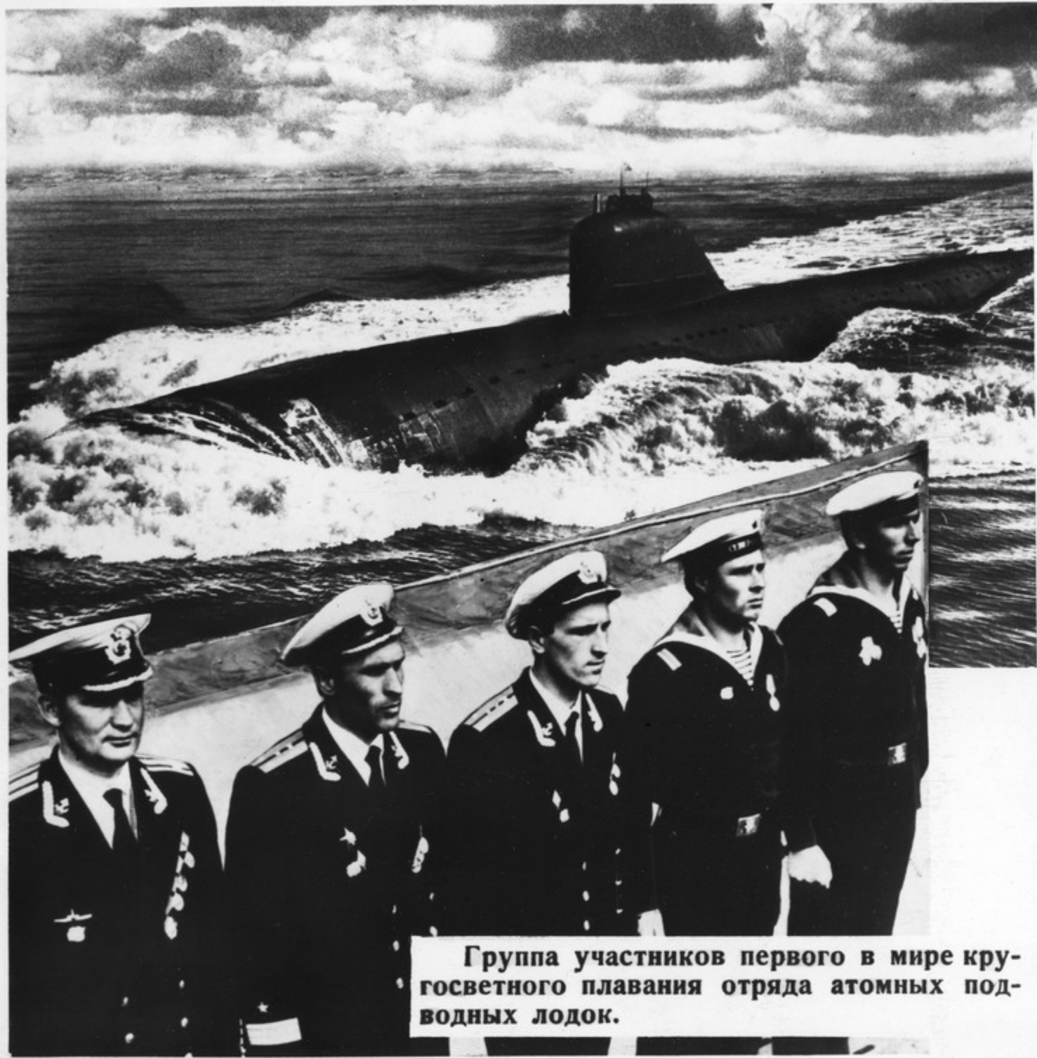
Группа участников первого в мире кругосветного плавания отряда атомных подводных лодок.