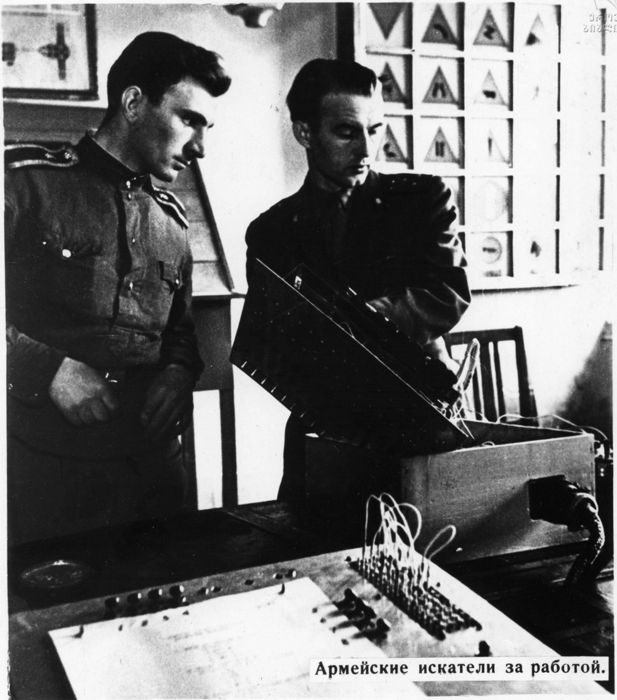
Армейские искатели за работой.

Особой любовью окружены в армии люди смелого поиска, армейские изобретатели и рационализаторы. Они ежегодно вносят тысячи ценных предложений с целью повысить боевую эффективность техники, улучшить учебно-материальную базу.