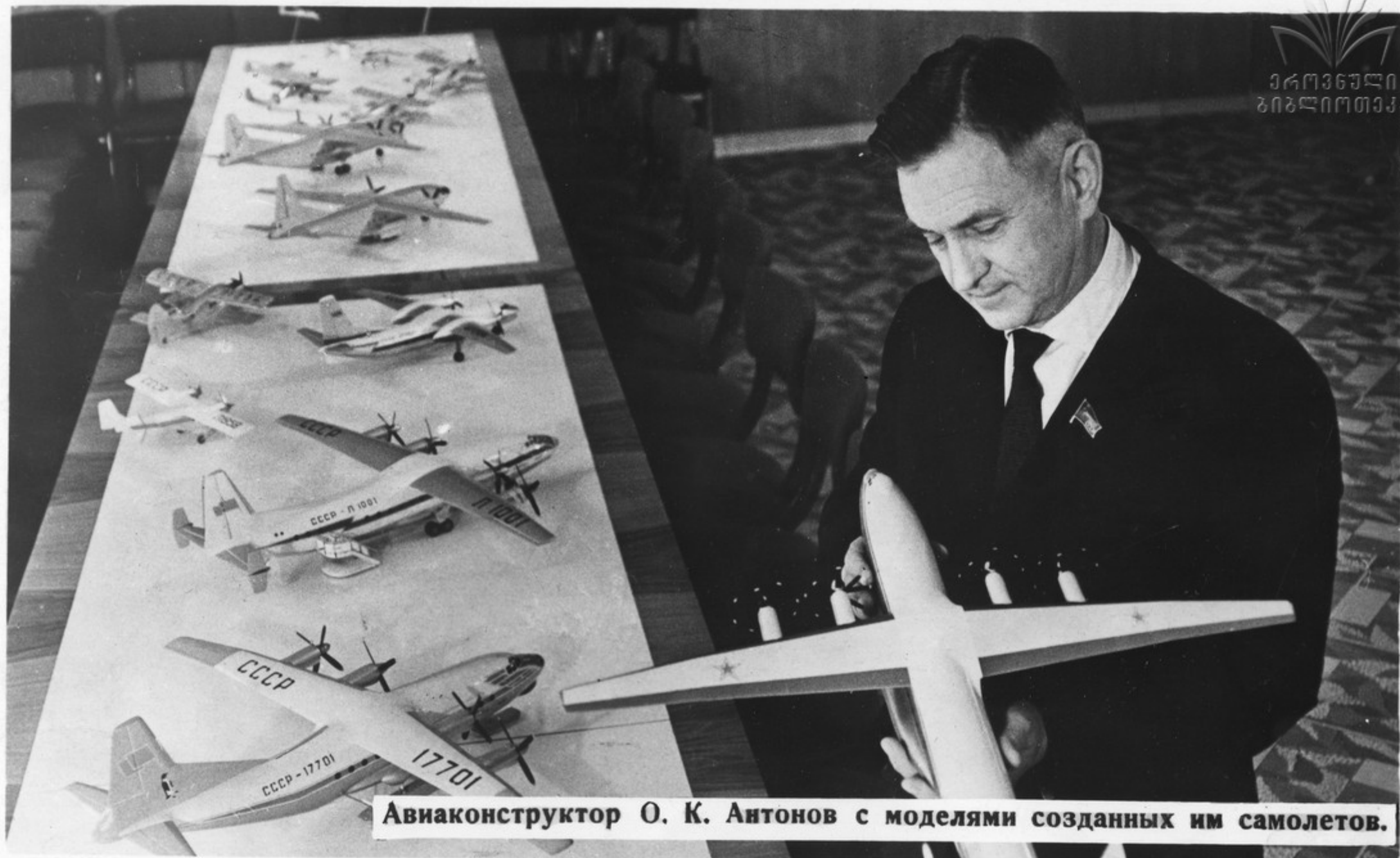
Авиаконструктор О. К. Антонов с моделями созданных им самолетов.

Огромная заслуга в создании новой авиационной техники принадлежит коллективам конструкторов под руководством А. Н. Туполева, О. К. Антонова, С. В. Ильюшина, М. Л. Миля, А. Г. Ивченко, А. С. Яковлева, А. И. Микояна и других талантливых творцов самолетов и авиационных двигателей.