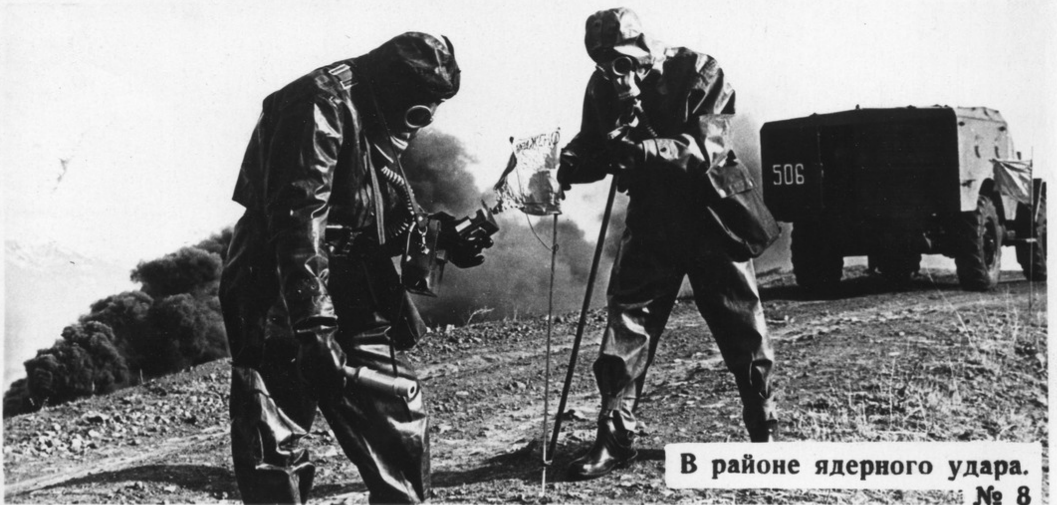
В районе ядерного удара. № 8

Овладеть искусством побеждать в современном бою сильного, технически оснащенного противника — не так просто. В напряженном ратном труде воины неустанно оттачивают мастерство, добиваются четкости и слаженности экипажей, расчетов, отделений. Подлинной школой боевой выучки остаются тактические занятия и учения, где воины учатся стремительно атаковать, преодолевать районы „ядерных“ ударов. Недаром говорят: „На учениях — как в бою!“