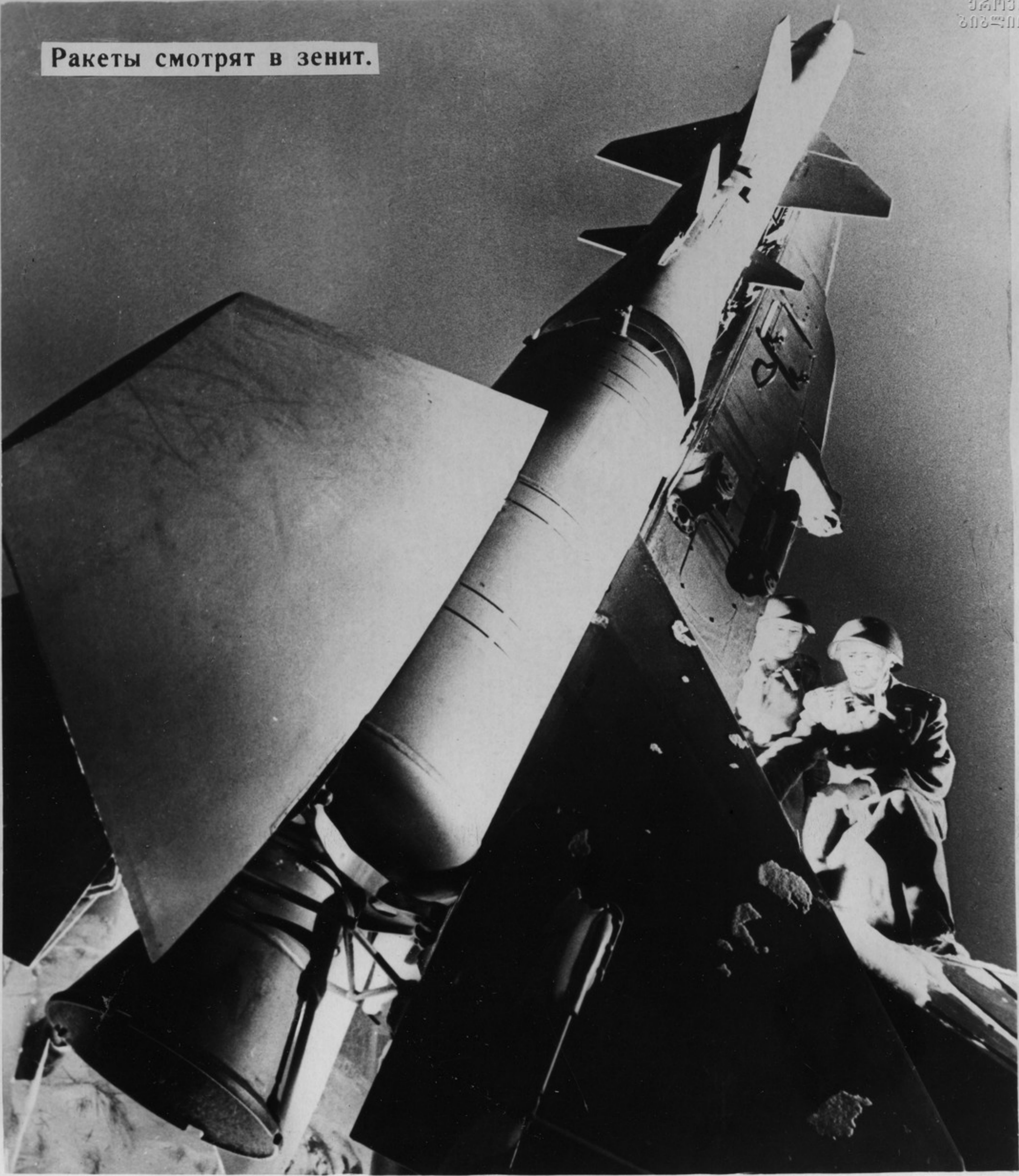
Ракеты смотрят в зенит.

Всегда начеку войска ПВО страны. Они вооружены зенитными ракетами, самолетами-перехватчиками, сложными радиотехническими устройствами и представляют собой надежный щит нашей Родины. Днем и ночью воины войск ПВО зорко несут боевую вахту.