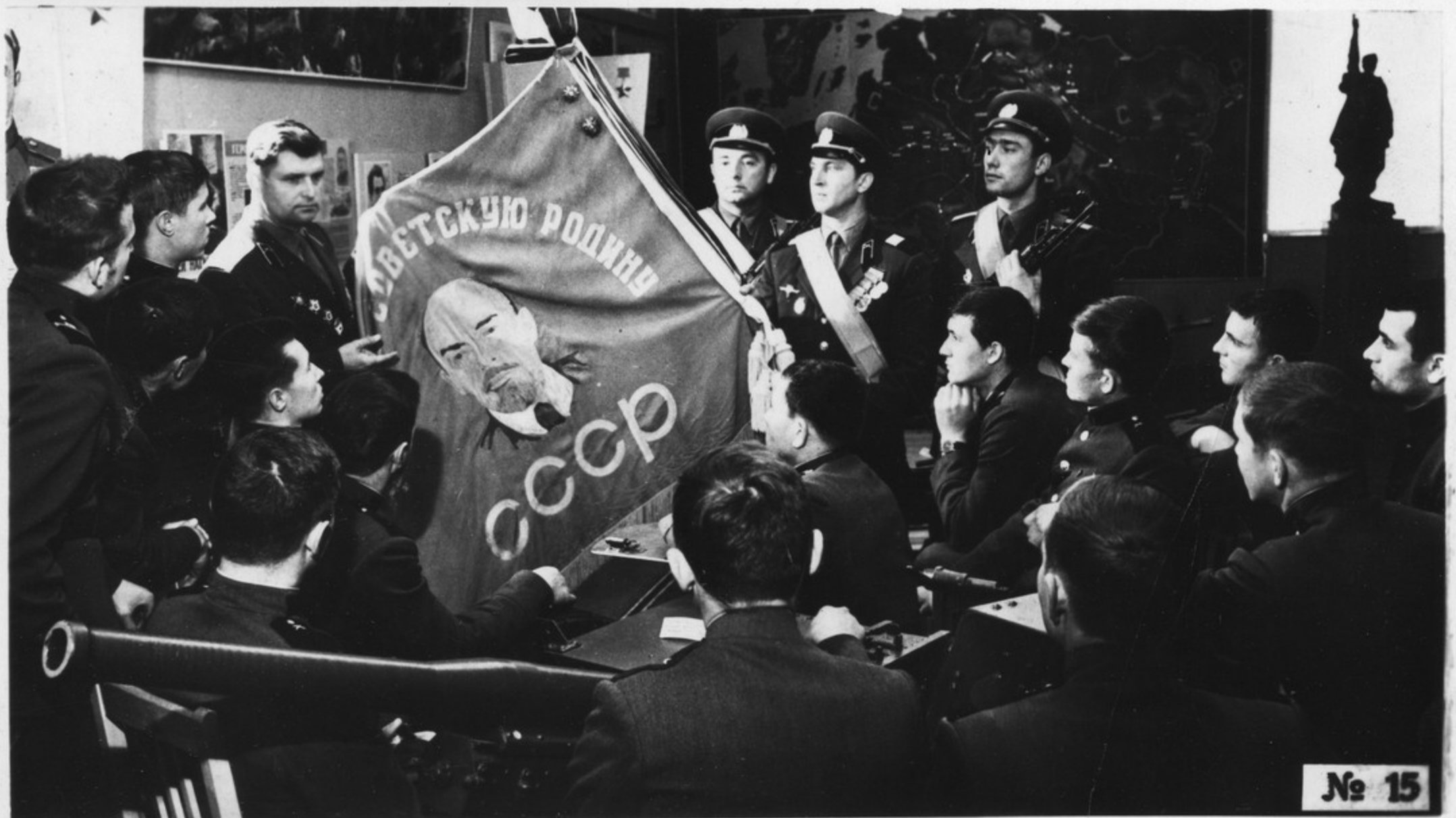
Встреча с ветеранами в комнате боевой славы.

Наши солдаты и офицеры в учебе и труде еще выше поднимают и дальше продолжают эстафету героев Октября и Великой Отечественной войны.