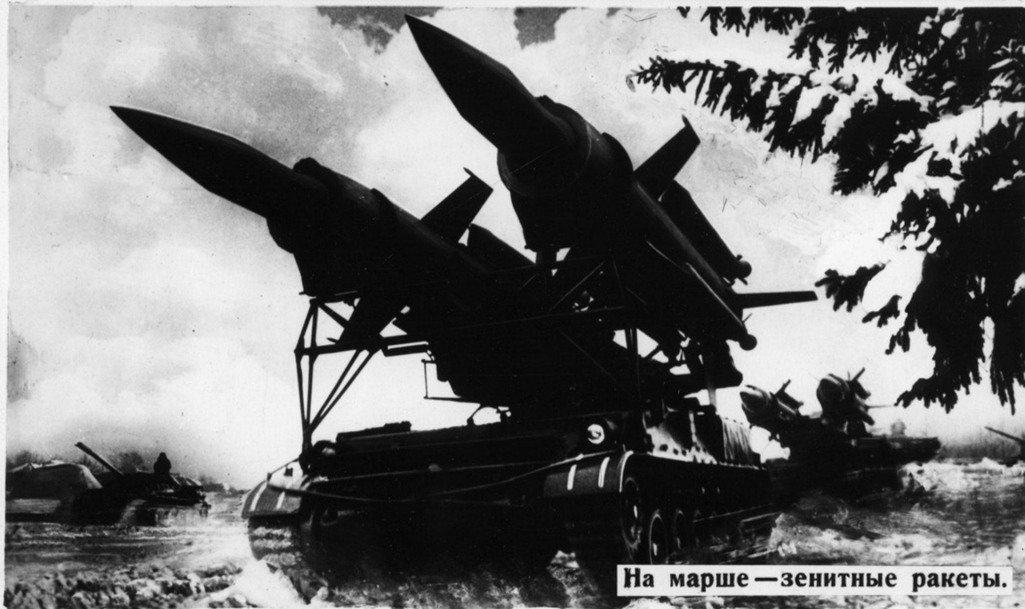
На марше — зенитные ракеты.

Коммунистическая партия и Советское правительство делают все, чтобы сорвать преступные планы агрессоров, проявляют неустанную заботу о дальнейшем повышении боевого могущества Вооруженных Сил.