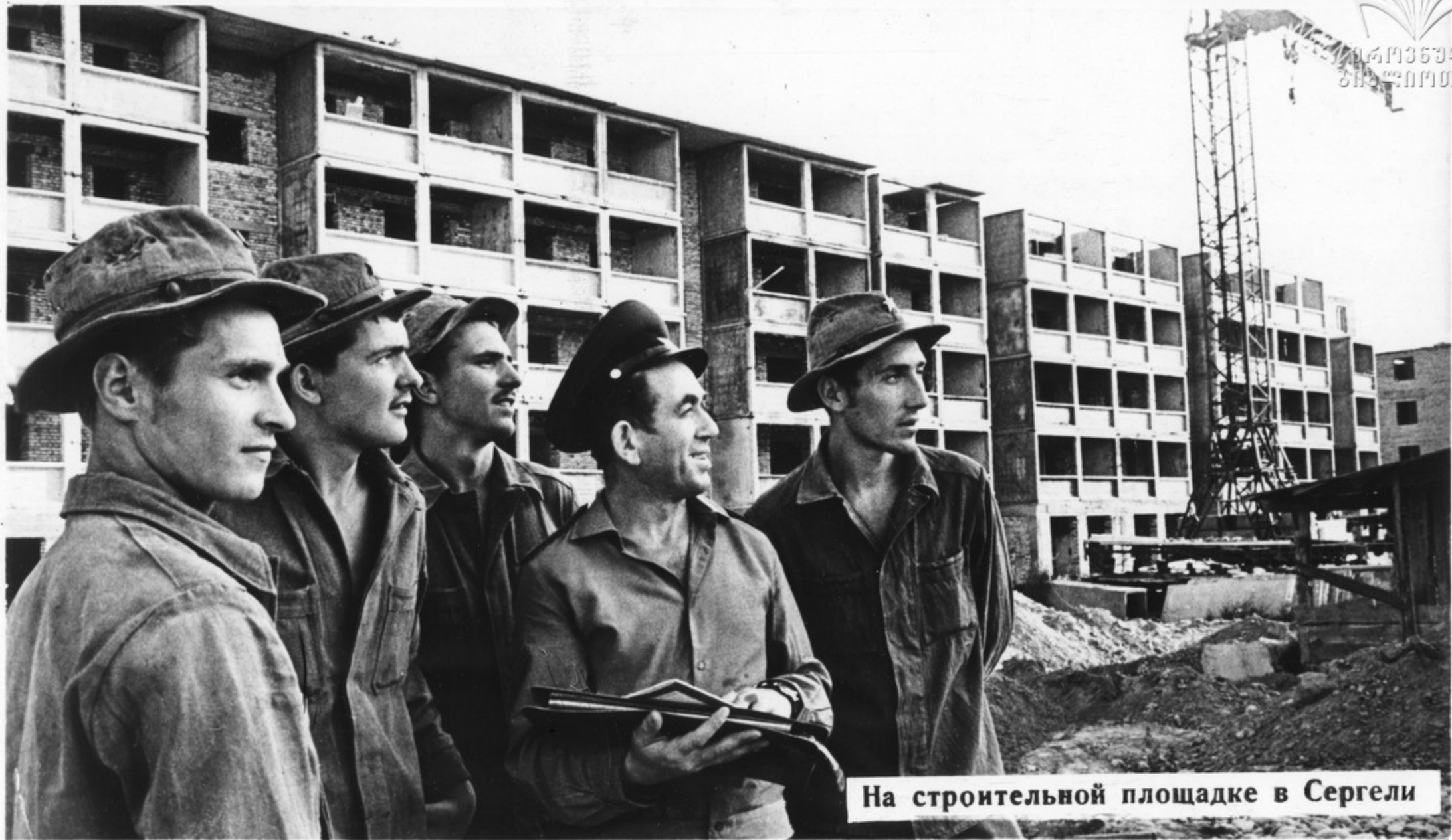
На строительной площадке в Сергели

Военные строители одними из первых откликнулись на призыв партии и правительства помочь пострадавшему от землетрясения Ташкенту. Нового города-спутника столицы Узбекистана Сергели еще нет на карте, но на 12-ти его улицах выросли жилые дома, магазины, школы, больницы и многое другое.