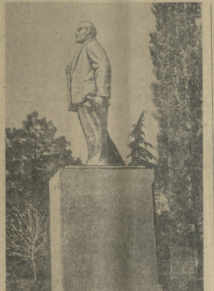
3. ი. ლენინის ძეგლი ვიბორსკიში