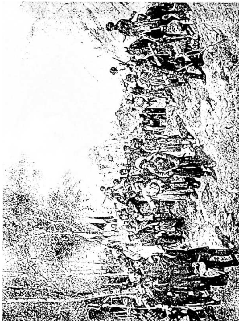
შამხლის ღატყვევება, 1859 წ.