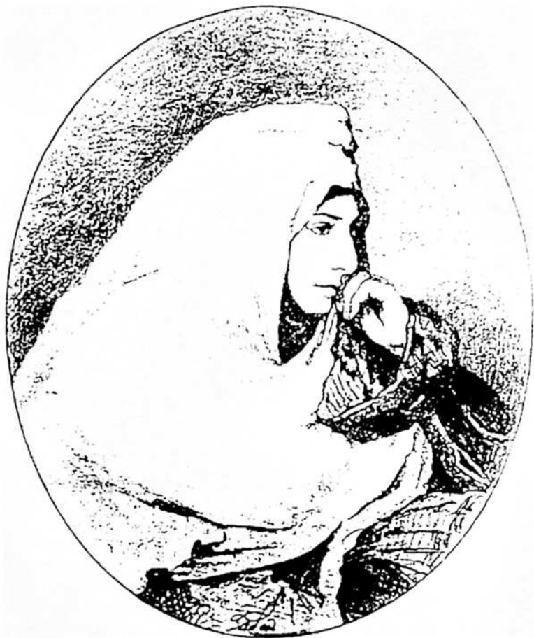
შამილის მეუღლე შუანაა