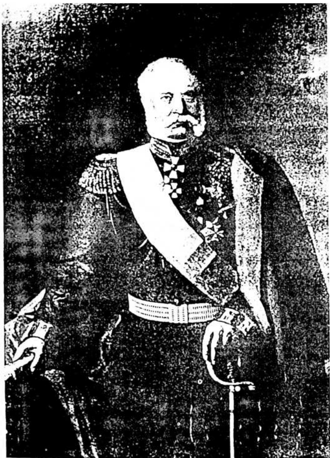
გენერალ-ფელდმარშალი, კავკასიის არმიის მოვარსარდალი, მეფისნაცვალი კავკასიაში, თავადი ალექსანდრე ბარიატინსკი