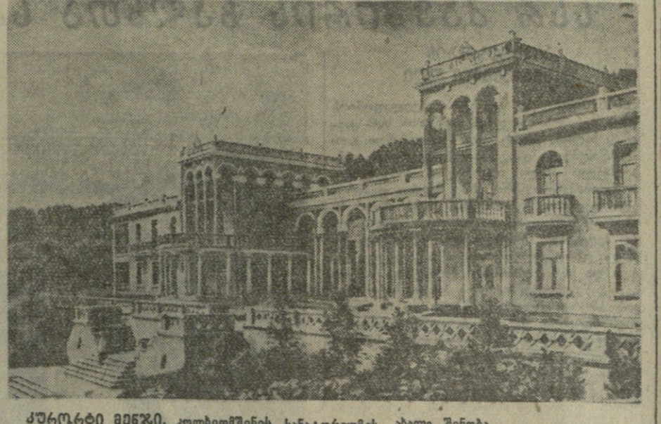
ქარტალი მხარის კომპლექსური სამსახურის ახალი შენობა.