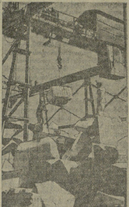
სურათები: 1. მოწინავე მცხეთა... 2. მარმარილოს ქარხანის ტერიტორია...