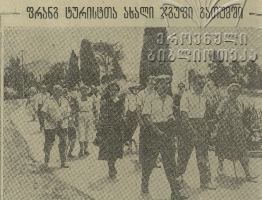
ბათუმი. (საქ. კორ.) ამ დღეებში ბათუმში მდებარე უნივერსიტეტის სტუდენტების მიერ მოწყობილი კულტურული პროგრამის ფარგლებში...