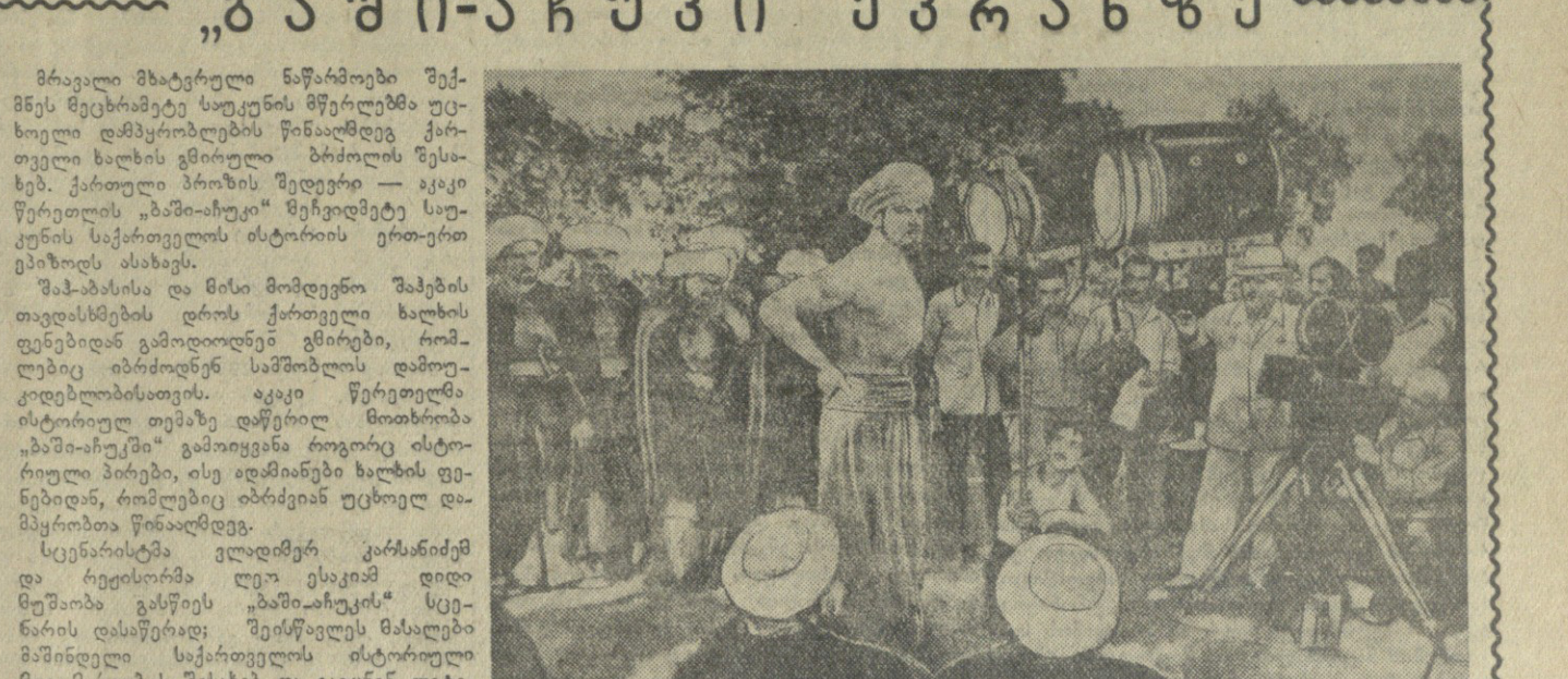
ბაზოი-აჩუკის მხატვრობის ჯგუფის ნაშრომი „ბაზოი-აჩუკი“ ეკრანების მუშაობის დასაწყისი.

„ბაზოი-აჩუკი“ მხატვრობის ჯგუფის ნაშრომი „ბაზოი-აჩუკი“ ეკრანების მუშაობის დასაწყისი.