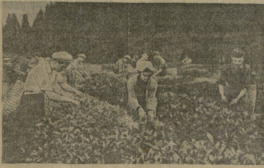
ლიათურის ჩაის საბჭოთა მეურნეობაში დასახარებლად ჩაიგდენ საქართველოს სა-სოფლო-სამეურნეო ინსტიტუტის მეცნიერის ფაქულტეტის სტუდენტი...