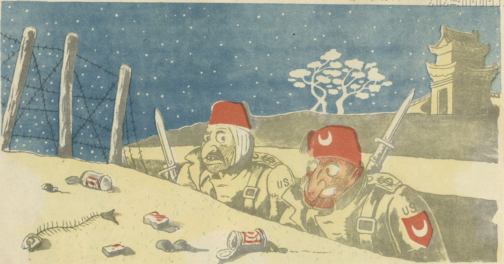
— გესმის, თახსინ, ამერიკელებმა ჩაღაც ახალი, იაფი იარაღი აღმოაჩინეს... ვაითუ ჩვენი დაცემული ფახიც დაეცეს... ჩაღა გვეშველება!..