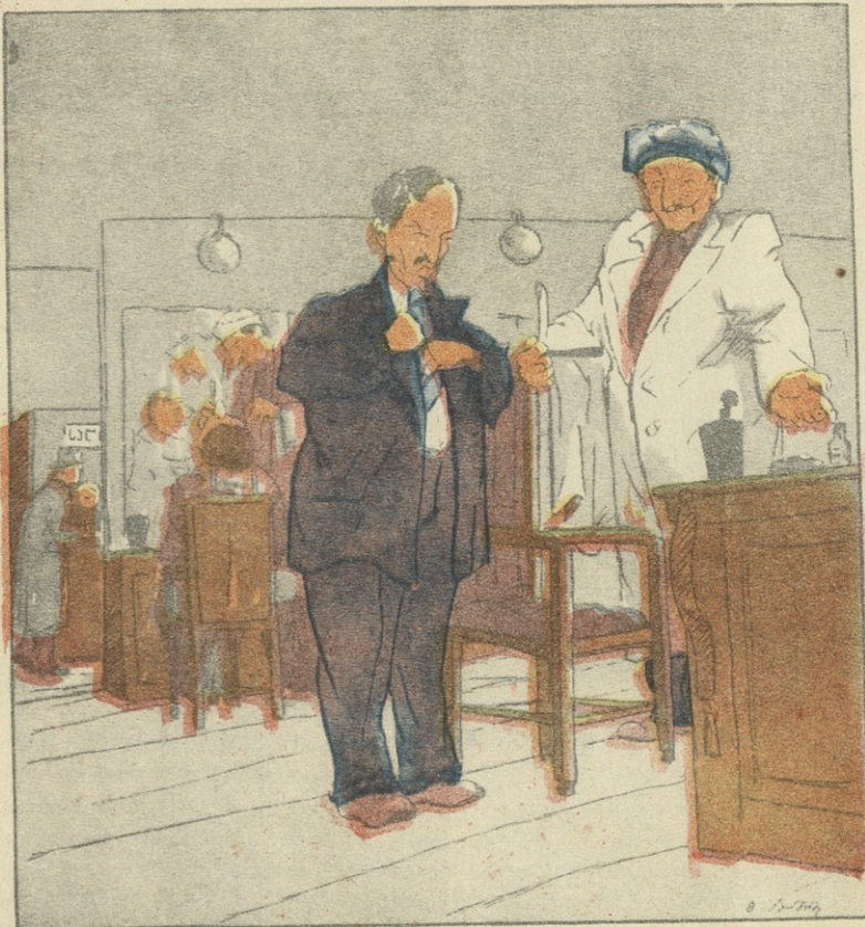
— რამდენი გადავიხადო ხალაროში? — ხალაროში რატომ, ვანა მოლარემ ვაგპარხათ!