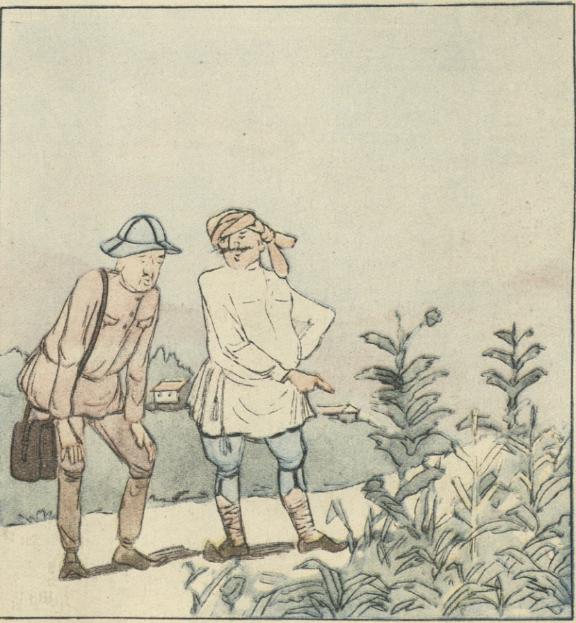
— რისი ბრალია, რომ სიმინდი ასე დაგვალულია? — ალბათ მისივე ბრალია, კულტურულ მცენარეს ველურმა ბალახმა როგორ უნდა აჯობოს!