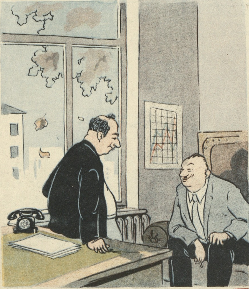
ნახ: ა. კანდელაკისა

— ზეს უკვე სცვივა ფოთოლი, მალე ზამთარი მოვა... — მალე ზამთარი მოვა, ყოველ ფეხის ნაბიჯზე ნაყინის გამყიდველს დავინახავთ, ყინულის დამამზადებელი ორგანიზაცია გვემას გადააქარბებს და ჩვენი შიკრიკის შვებულებაში წასვლის დროც მოვა!..