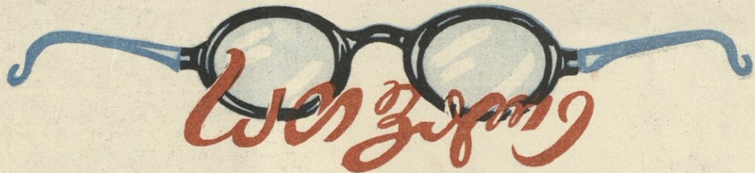
3. . . . .

დევდიმა მალაზია ჩქარი ნაბიჯით გაიარა და როგორც კი ქუჩაში გავიდა, იმწამსვე მოიხსნა სათვალე. დიდხანს სინჯა და ატრიალა ხელში. „თვალში სინათლე მოჰყვა, — ფიქრობდა დევდი, — მაგრამ ძვირად კი ვიყიდე... არ არის საშველი, ცეცხლი ეკიდება ყველაფერს...“