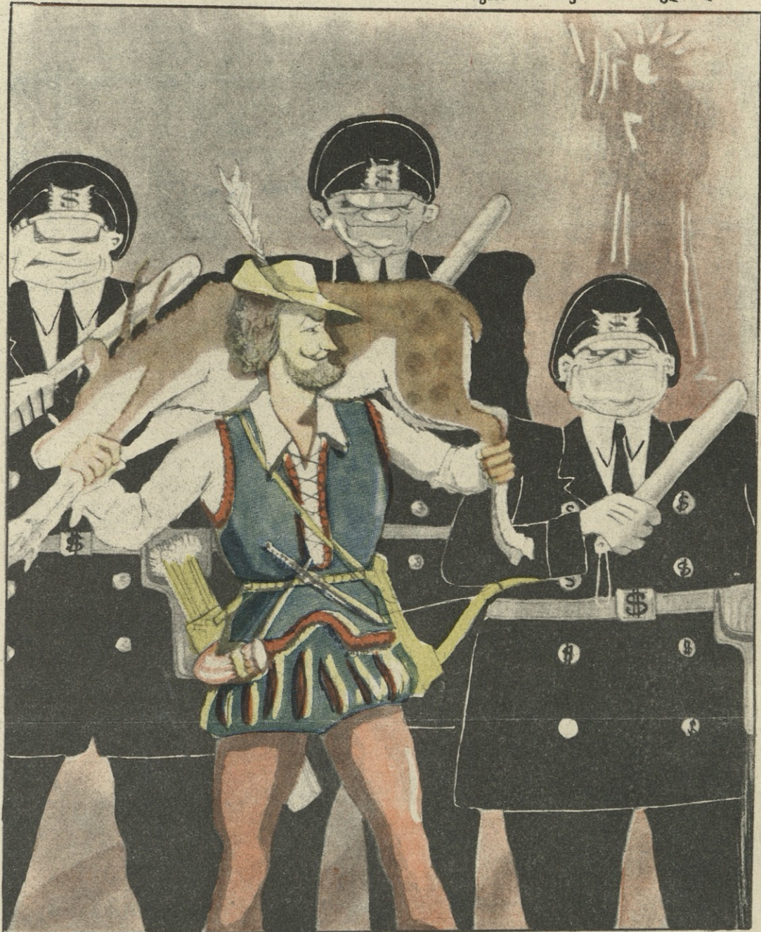
აკრძალულია რობინ ჰუდის კითხვა. ხხენება, რადგან თვით ბანკი ამერიკელ ბანკირს აშინებს. თავისი თავის დასაღუპად ინგლისელებმა ამით ხელახლა ამერიკა აღმოაჩინეს!

განთავისუფლდა სტრიაპჩიებიდან და კირვეული მახარის უფროსებიდან. ხარიტონი ღრმა მოხუცია. მისი ერთი შვილიშვილი თევზის ჯიშების საკვლევოსამეცნიერო ინსტიტუტში მუშაობს. ერთხელ იგი ხარიტონს ესტუმრა და საჩუქრად თავისი ახლად გამოყვანილი ჯიშის თევზი მიართვა.