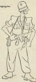
ნახ. ა. ფირცხალაგისი

თავის წვრილია დგებებით ეგას მამაყენინა ბაქია, თოფუ-იარაღის ჩხარწინთ ორღის არ უტრბახავი!