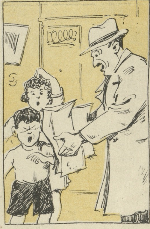
ამ ქალაქის პარკს არტელის ბეჭედი აზის.