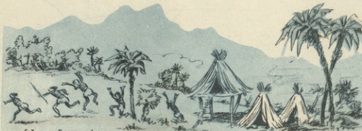
ნახ. ა. კანდელაკისა