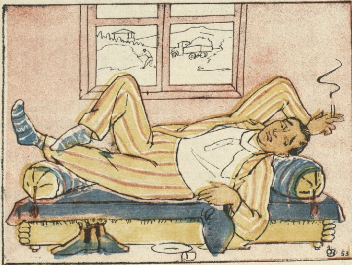
ნახ. გ. ფირცხალავასი

სამწუხარო არ დაურთოს სასაცილოს და მოქნარებით არ მოგვიკვდეს საცოდავი!