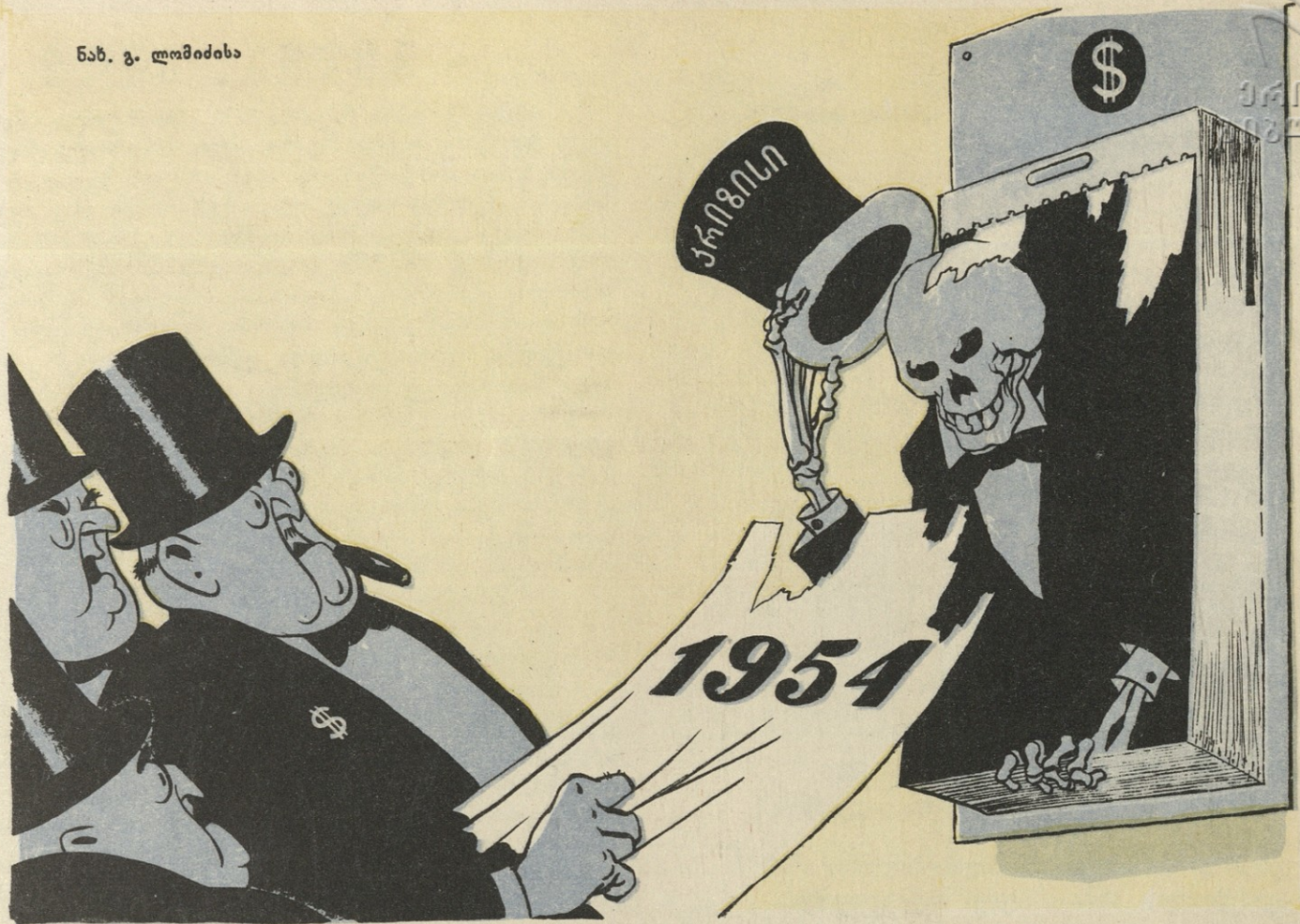
დიდი იმედით კალენდარს ფურცელი ჩამოახია, — დახვდა იქ ძველი ნაცნობი და გადმოსძახა: —ახია!