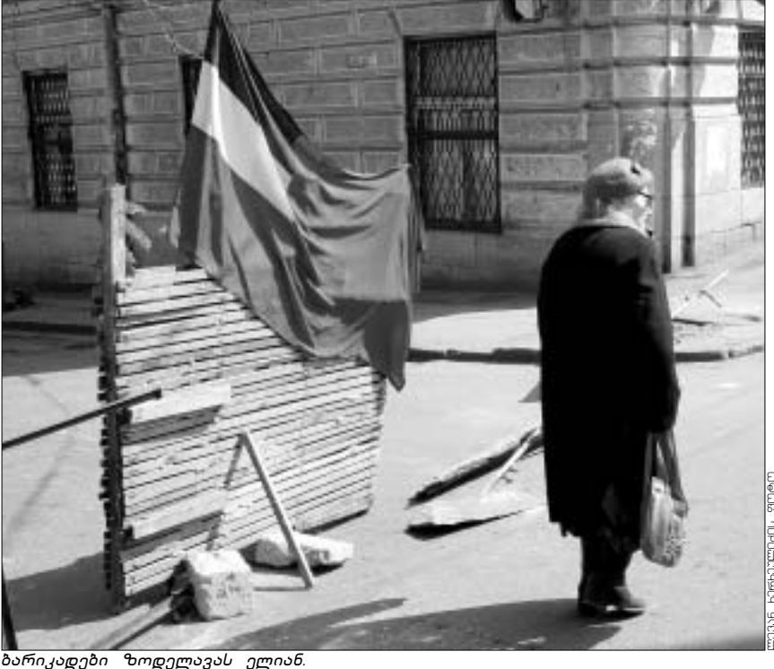
ბარიადები ზოდელავას ელიან.

ქალაქის მერია სოლოლაკსა და მთანმინდაზე ავარიულ სახლებში მცხოვრებთ საინტერესო წინადადებას სთავაზობს, - ძველ ბინებს და-გინგრეთ, სპონსორს ვიშოვით, ახალს ავაშენებინებთ და ახალ სახლში კუთვნილ ფართს მიიღებთ; მანამდე კი დროებით თავშესაფარს მოგცემით.