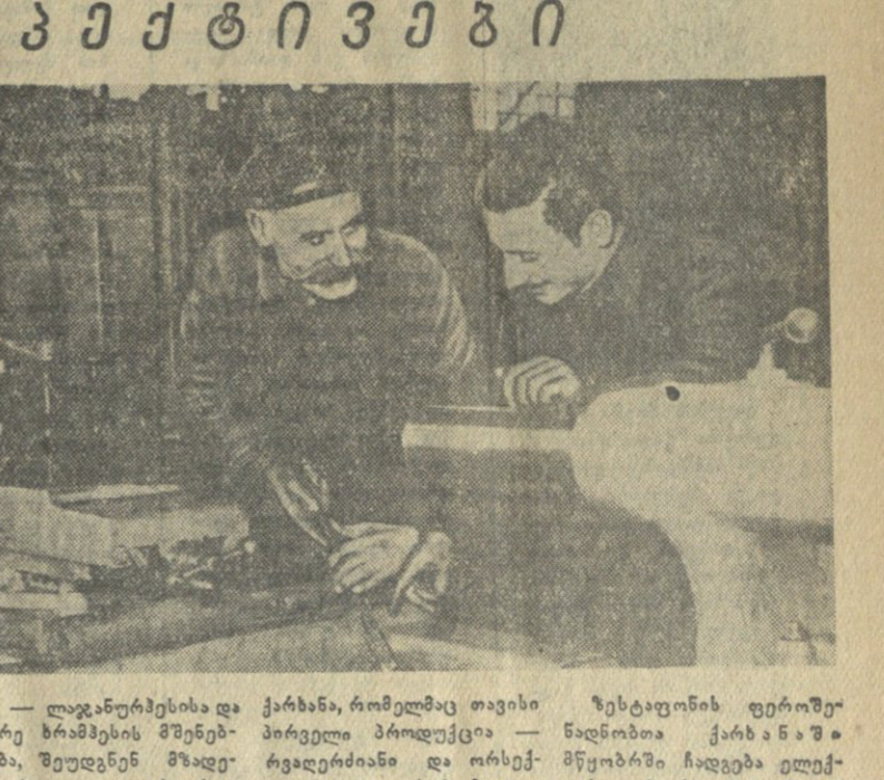
მის — ლაგუნის მშენებლობის დასრულების შემდეგ... უფრო ადრე განხორციელდეს...