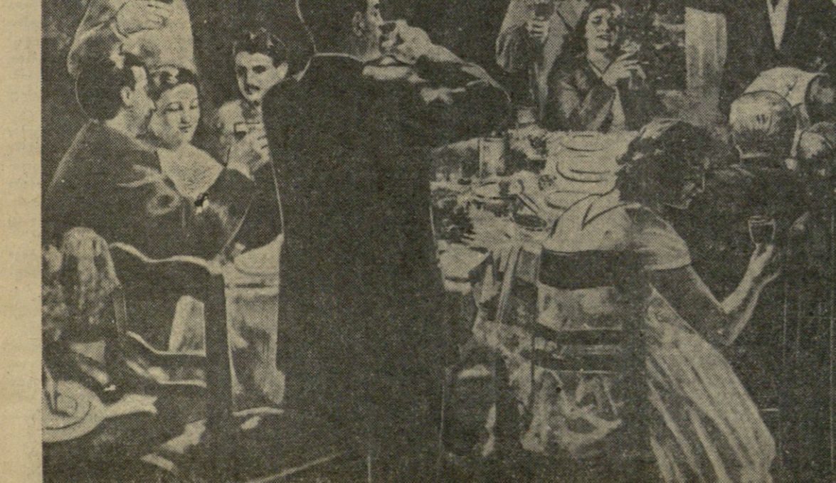
მედიები ახალი წელი.

მშვიდობის შენარჩუნებისა და განმტკიცებისათვის ბრძოლის საქმეში თვალსაჩინო დამსახურებისათვის მიენიჭა „ხალხთა შორის მშვიდობის განგვიცხადისათვის“ საერთაშორისო ლენინური პრემიის მემორიალი. მემორიალი დაიწესა 1957 წელს 11 ნოემბერს.