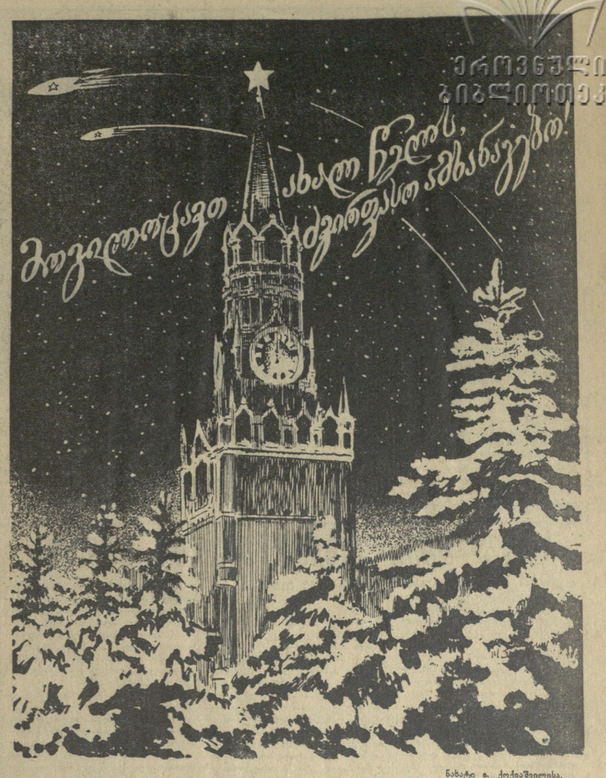
ნახატი ა. კოქიაშვილისა

გალავნიონ ტანიძე საქართველოს სახალხო პოეტი მრავალჯერადი წიგნი