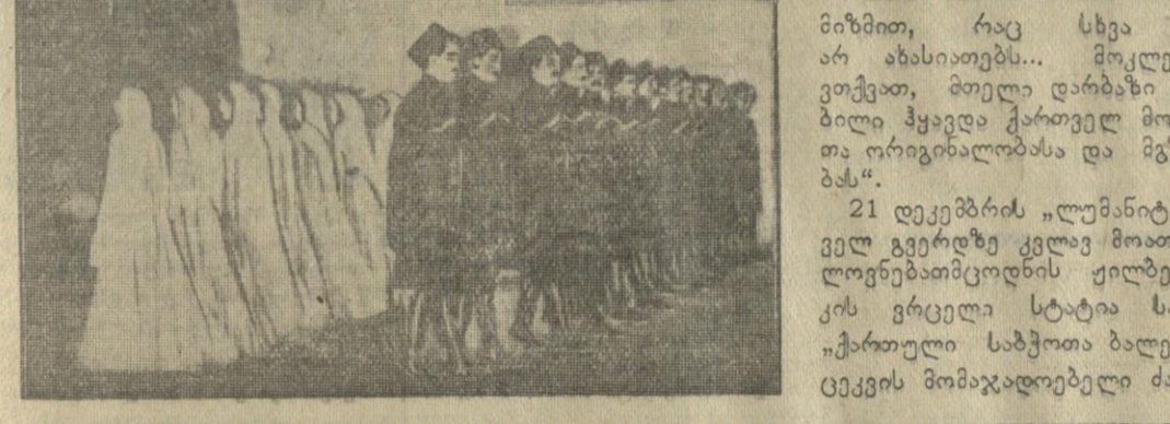
Brillante première du BALLET SOVIÉTIQUE CAUCASIEN hier soir à l'Alhambra. A L'ALHAMBRA DYNAMISME — BEAUTE — NOBLESSE LES BALLETS CAUCASIENS