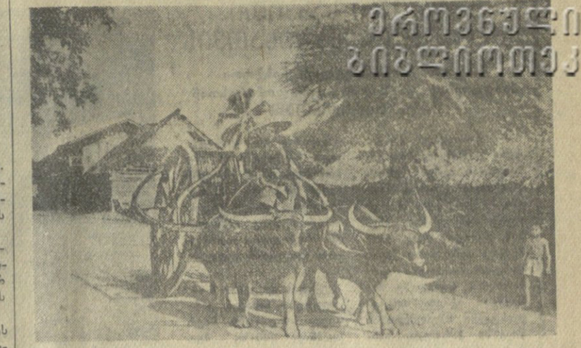
ბაბა დანი. სოფელ ხანა მის შუხა.