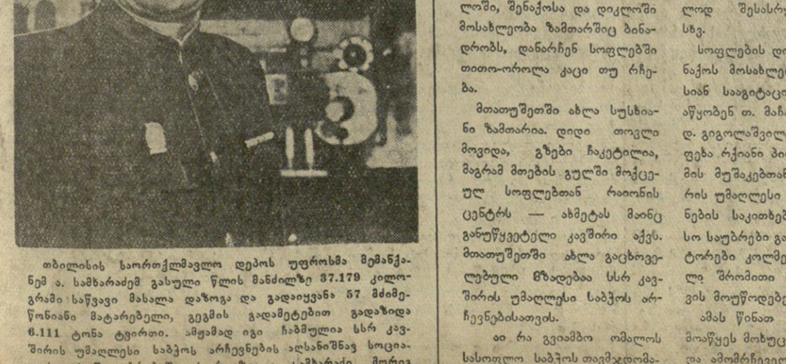
თბილისის საერთაშორისო უნივერსიტეტის მემწივენი. ა. საბაძაგის გახლავთ წლის მანძილზე 37.170 კილოგრამი საწვავი მასალა დაწვავა და გადარჩენა 57 მძიმე წონის მატარებელი, გემის გადაშენების გადაწყვეტილება. აქ მას დიასახლისები გულბოლოდ შეხვდნენ. აგიტპუნქტის მთავარი საქართველოს კომპარტიის ახლანდელი დამთავრებული XVIII ყრილობის მასალებზე.

მთათუშეთში, საქართველოს რესპუბლიკის მთავრობის მხარეზე მდებარეობს. მისი დასახლება მალე დაიწყებს მშენებლობას. აქ მას დიასახლისები გულბოლოდ შეხვდნენ. აგიტპუნქტის მთავარი საქართველოს კომპარტიის ახლანდელი დამთავრებული XVIII ყრილობის მასალებზე.