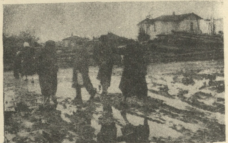
სურათზე: რაიკავშირისა და რკინიგზის სადგურის გვერდით მდებარე ტერიტორიის ხედი.