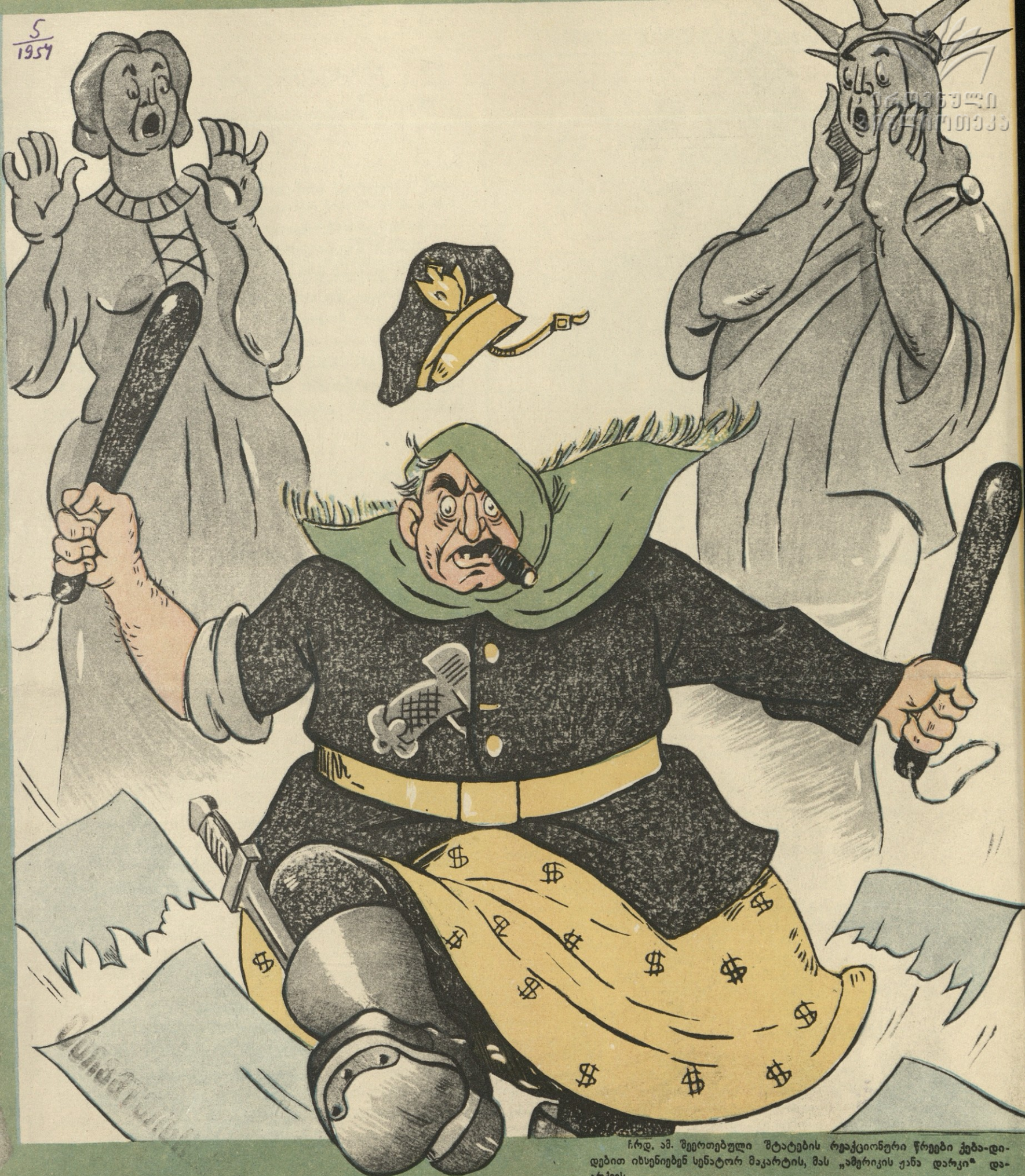
ჩრდ. ამ. შეერთებული შტატების რეაქციონერი წრეები ჰეზა-დინდებით იხსენიებენ სენატორ მაკარტის, მას „ამერიკის ენა ღარკი“ ღარკვეს.