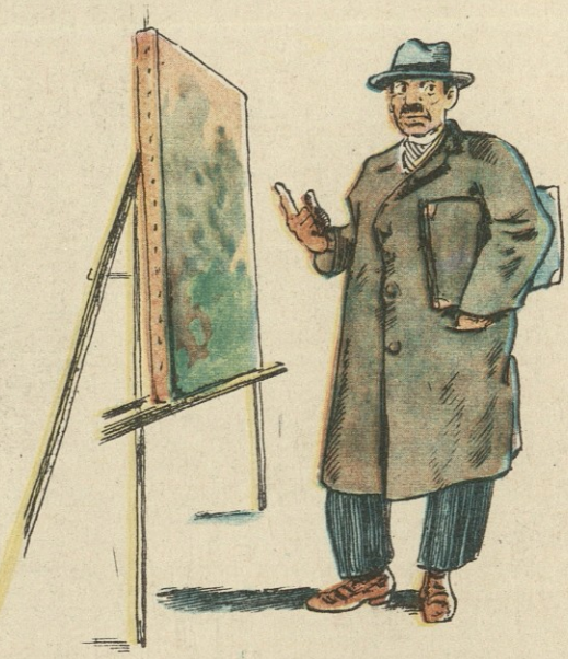
კრიტიკოსი პროფესორი წინაშე — თვითონ მხატვარს ვკითხე და ვერ ამიხსნა რისი თქმა სურ- და ამ სურათით... მე რაღა ვუ- თხრა აუდიტორიას!?. ისევ ფე- რების პოეტურობისა და მრუდე ხაზების ესთეტიკურ მნიშვნელო- ბაზე ვილაპარაკებ...