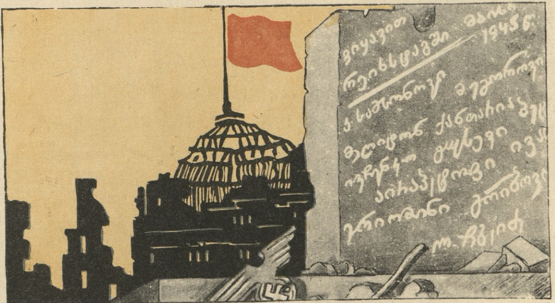
თვით „რეისტაგი“ ლალაღებს, ერთხელ მტერი სიკვდილმა როგორ მოსცედა... გვახსოვს და ვიცნობთ, მისი წყაღობით ვისწავდეთ ქვეყნად ხელისმოწერა.