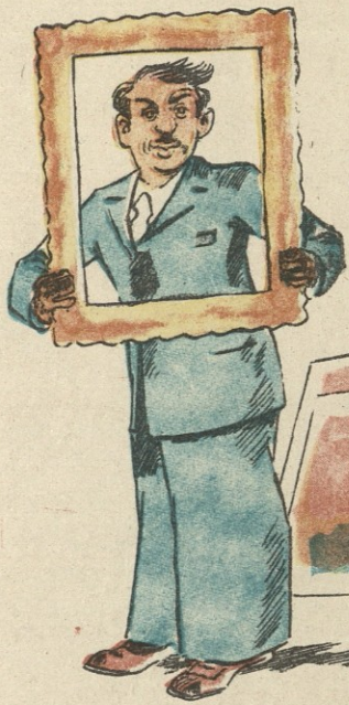
ზარბაზი მხაზარის ავტოპორტრეტი ჩარჩოში — პორტრეტების ხატვის დროს ზო- გი თუ ფოტოს იშველიებს, ჩემთვის ეს ჩარჩოც საკმარისია...