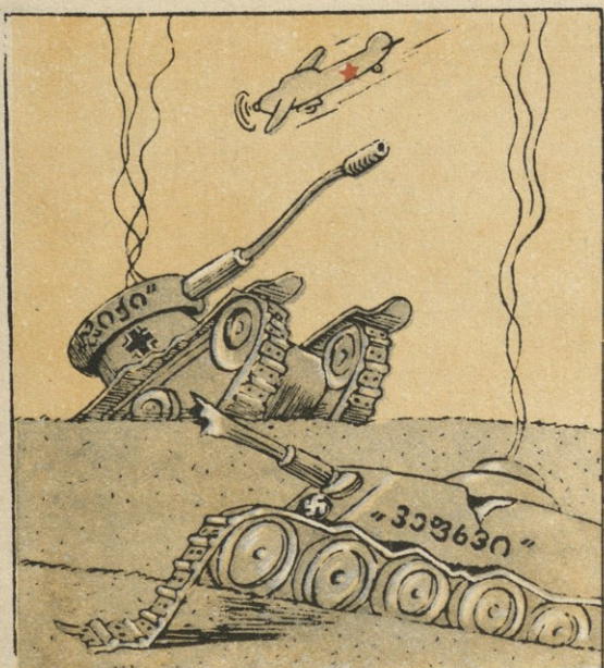
ნახ. მ. თთარ-ისა