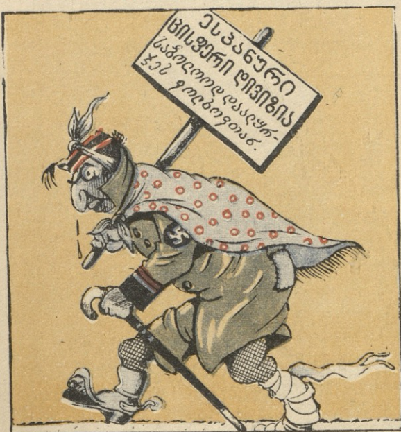
ცისფერ ვაჟბატონს გული დაენვა — არტიდერის ცეცხლის შეფრქვევით. გვახსოვს და ვიცნობთ, მათი წყაღობით სხვადასხვა ფერშიც კარგად ვერკვევით.