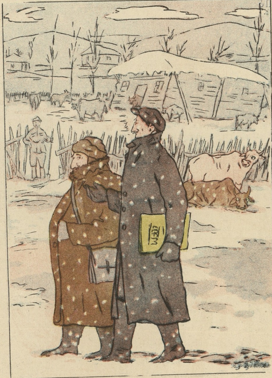
— მარტის დიდი იმედი მქონდა, მეგონა რომ გაზაფხული მომისწრებდა... მაგრამ მომხსნეს... გაზაფხულს მკაცრმა დადგენილებამ დაასწრო...

წაგებულმა მხარემ, როგორც წესია, 1953 წელს საქმე თბილისში, უმაღლეს სასამართლოში გაასაჩივრა. იმავე წლის 25 აგვისტოს უმაღლესმა სასამართლომ ჩასთვალა, რომ ქუთაისის მესამე უბნის სასამართლოს გადაწყვეტილება ამ ფრიად მნიშვნელოვანი საქმის მიმართ ნაჩქარევი და საფუძველს მოკლებული იყო. საქმე დაარღვია და კვლავ ქუთაისის პირველი უბნის სასამართლოს დაუბრუნა.