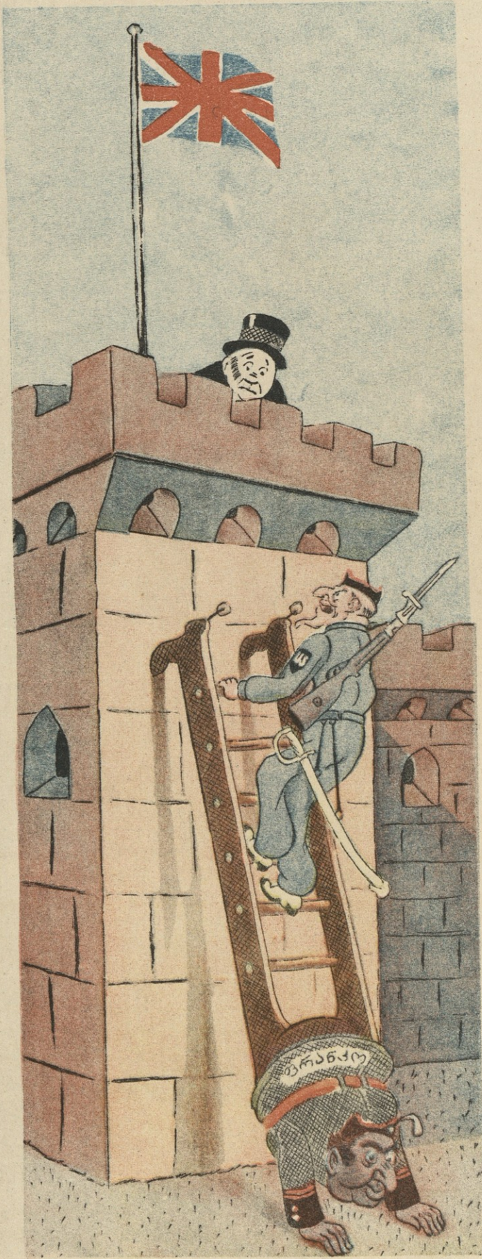
ხურათზე: ამერიკული კიბე, ამერიკელი ძია და ინგლისელთა ციხე-სიმაგრე ჰიბრალტარი.