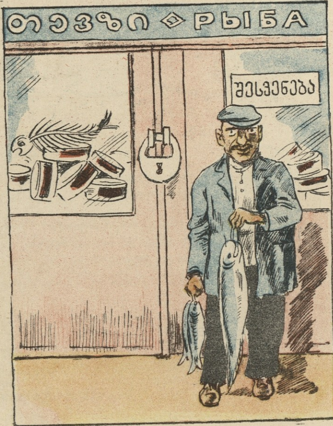
— ამბობენ რომ საქთევზს თევზი არა აქვსო,—ვას! მოდით როცა შესვენებაა და ჩემი თავი თქვენ გენაცვალთ!