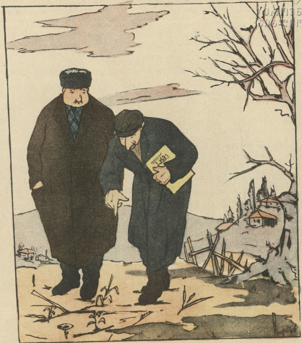
— ტყუილ-უბრალოდ მივიღეთ საყვედური მოსავლის ცუდად აღების გამო, ელიზბარ, დადგა გაზაფხული და თვითმუშა დაკარგული მარცვალი ხელახლა აღმოცენდა... სხვებს კი ჯერ თესვაც არა აქვთ დაწყებული.