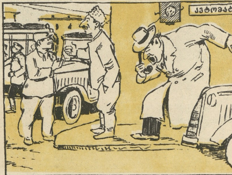
ნახ. ე. ცომიასი

— რაო, რაო? ღმერთო ჩემო, აქ ისეთი ხმაურია, რომ არაფერი მესმის... შენ თუ გესმის რაიმე, სულიკო... გესმის უველაფერი გესმის? მაშ რატომ ვერ გაიგე რას გელაპარაკები?.. რა ვქნა, მთელს ქუჩას მე ხომ ვერ დავაჩუმებ!..