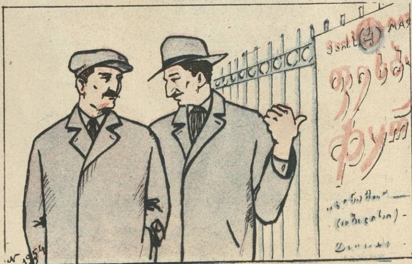
ნახ. 5. ვალაკორიასი და 5. ჯობაძისა

— დღეს შეხვედრათ ფეხბურთში, საინტერესოა ვინ მოიგებს?