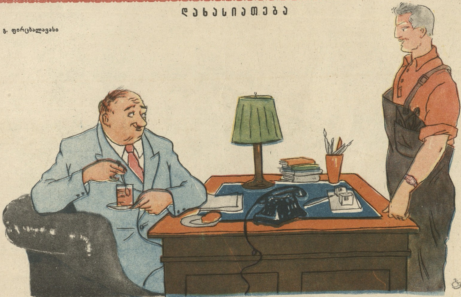
ნახ. გ. ფირცხალავასი