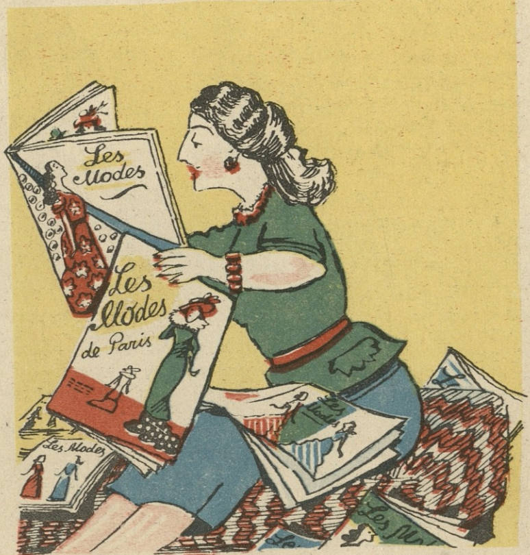
ცოდნის წყაროს დაეწაფა, მის წინ მთელი პარიზია!