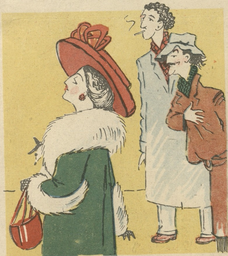
გამოცდებიც ჩააბარა დოცენტს, მალაღნაზისხიანს...