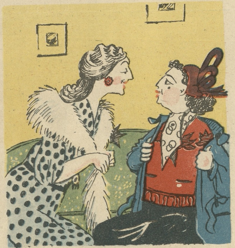
ბოლოს გამოცდილებასაც უზიარებს თავისიანს. დელი-ოდილავეამ

რედაქტორი კ ა რ ლ ო კ ა ლ ა ძ ე. სარედაქციო კოლეგია: გრ. აბაშიძე, აკ. ბელიაშვილი, ი. გრიშაშვილი, უჩა ჯაფარიძე, ი. ნონეშვილი, ს. ფაშალიშვილი.