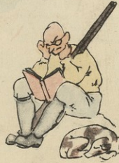
— პრაქტიკა არა მაკვს, თორიას მაინც შევიწყველი.

— არ ტყუილად მინდვრად დღეს ფრინველს ჩამოიქო არ იმის. რა ამაყია? — წივილია, ჩემო ვარკო, კვირა დღეა. მინდვრებზეა ფრინველ ააფრინებს. ირწინათ-ნაწინათო უნდა მოხდეს. უნდა ჩიტი. უნდა უკრადლუდი შიშ დაეხებოდეს.