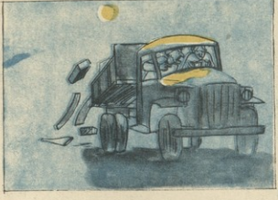
ღამნაშევი, როგორც იტყვიან, თავისი ფეხით წაიყვანა პასუსს სახეზად.