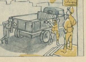
და, აი, შოფერი ახლაც ახლად-მართადათ კაცი აღბრინდა... ღარაჯე მხოლოდ ერთი რამ გაზიარა მხედველობისად: ავტომობილის ავტომობილის იცდებოდა...