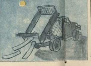
თღორთორღი გზით, ანაწილი მიქროდა მძიმე ავტო, ღარაჯისა და შოფრის ღანძრად და დღეიდანაა მტკიცის გუზებს აღწებუბოდა...