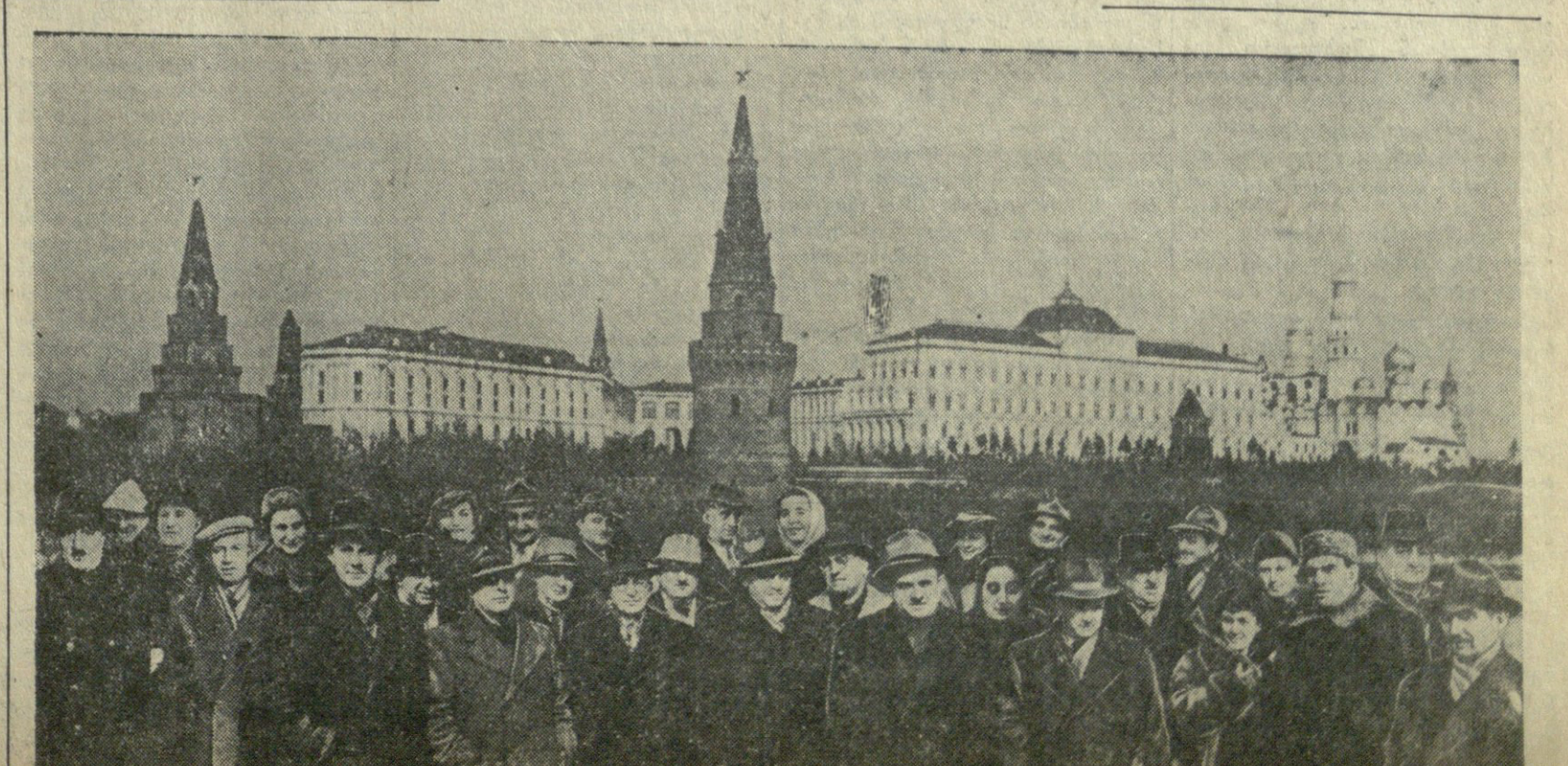
საბჭოთა კავშირის კომუნისტური პარტიის ცენტრალური კომიტეტი და სსრ კავშირის მინისტრის განხორციელებული საბჭოთა პარტიის საზღვარ-საზღვრო კავშირის საინფორმაციო კავშირების გაუხატვის დასრულება