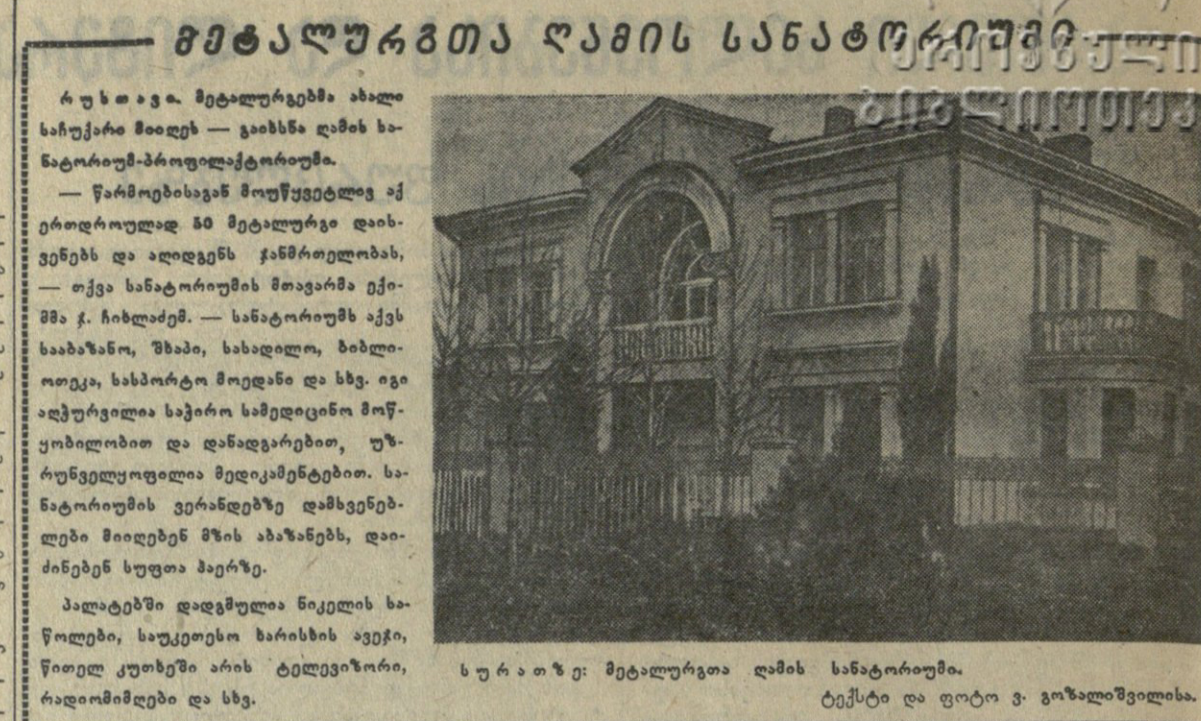
სურათი: მეტალურგთა დამის საბჭოთა კავშირის