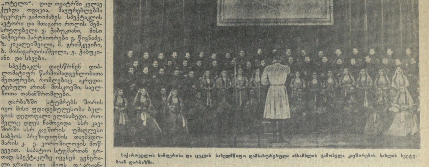
საქართველოს სიმღერისა და ცეცხლის სახელმწიფო დამსახურებული ანსამბლის გამოსვლა კავშირების სახლის სცენაზე დარბაზში.

ღმს ჩვენი სამშობლოს დედაქალაქ მოსკოვში მუშაობის ოქროსი წლები მთავარი მნიშვნელობის საქმეა. რამდენიმე წელიწადის განმავლობაში საქმეების განხორციელების მიზანობაა სახალხო მნიშვნელობის საქმეების განხორციელება. სახალხო მნიშვნელობის საქმეების განხორციელება არის სახალხო მნიშვნელობის საქმეების განხორციელება. ამ საკითხზე გამოვეხილეთ ა. ს. ხრუშჩოვის მოხსენების მიხედვით, ინტერესი გამოიწვიეს ჩვენი ქვეყნის შრომითი ფართი მასზე. მართალია, ახლა იმის შესახებ არ არის ცნობილი, რომ კომლენურიზაციის მიხედვით საქმეების განხორციელების მიზანობაა სახალხო მნიშვნელობის საქმეების განხორციელება. ამ საკითხზე გამოვეხილეთ ა. ს. ხრუშჩოვის მოხსენების მიხედვით, ინტერესი გამოიწვიეს ჩვენი ქვეყნის შრომითი ფართი მასზე. მართალია, ახლა იმის შესახებ არ არის ცნობილი, რომ კომლენურიზაციის მიხედვით საქმეების განხორციელების მიზანობაა სახალხო მნიშვნელობის საქმეების განხორციელება. ამ საკითხზე გამოვეხილეთ ა. ს. ხრუშჩოვის მოხსენების მიხედვით, ინტერესი გამოიწვიეს ჩვენი ქვეყნის შრომითი ფართი მასზე. მართალია, ახლა იმის შესახებ არ არის ცნობილი, რომ კომლენურიზაციის მიხედვით საქმეების განხორციელების მიზანობაა სახალხო მნიშვნელობის საქმეების განხორციელება.