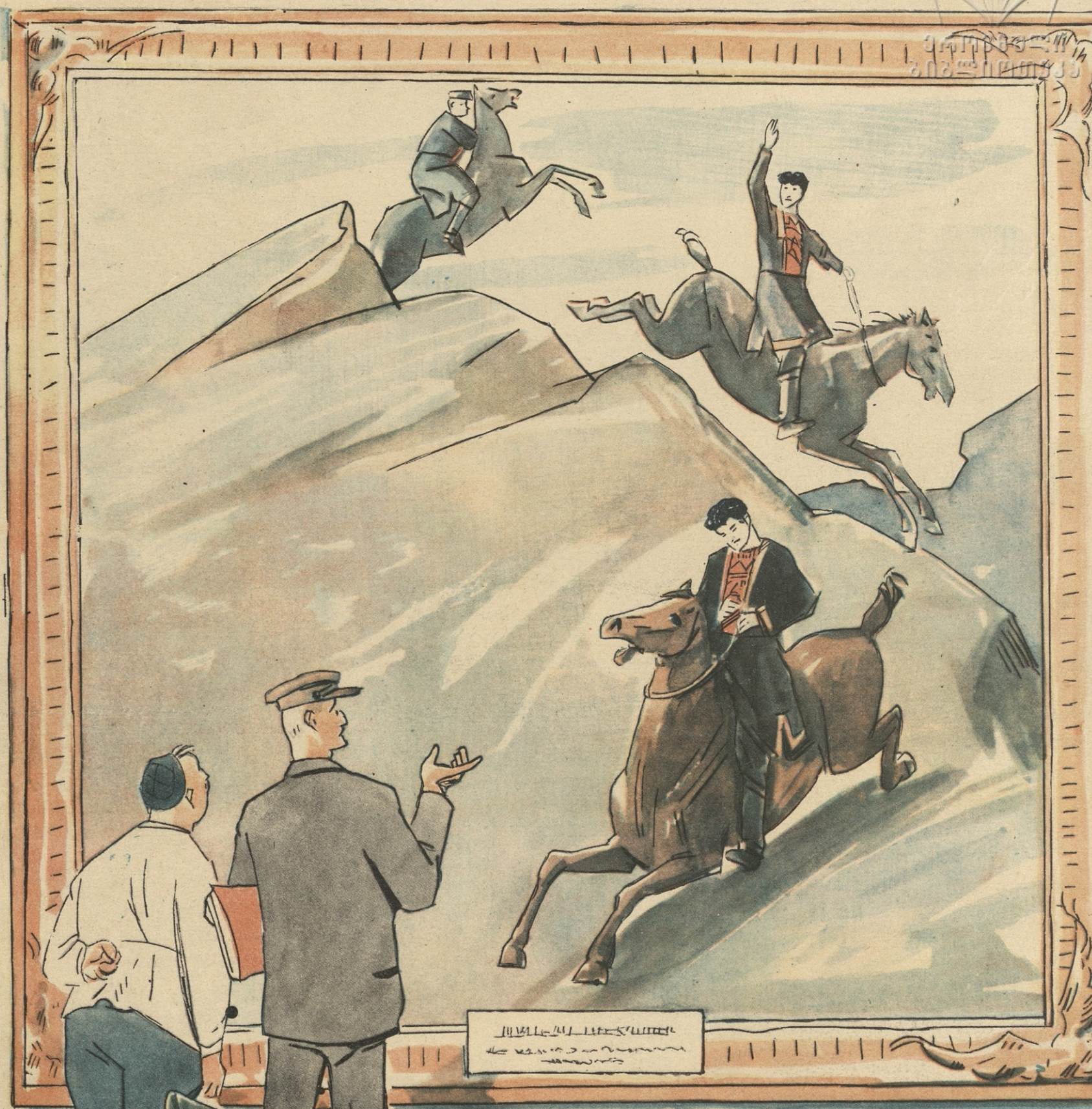
„კოლმეურნის“ რესპუბლიკურ პირველობაზე ცხენოსნობაში სვესურებმა და მთიულეებმა უჩვენეს სპორტის მაღალი კლასი—ცხენებით მთიდან დაშვება.

საქართველოს სსრ-ის მთავრობის ბიბლიოთეკა 347 18/11 57