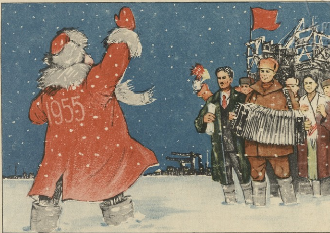
ახალი წელი — ჩვენ აქ პირველად გვხვდით ერთმანეთს, თქვენს მოხვლას გავუმარჯოს!

ზოგიერთი დანებებულებაში მოხონებების მიმართ დაკარგული თავაზიანობა სასწრაფოდ მოინახოს და პატ- რონს დაუბრუნდეს.