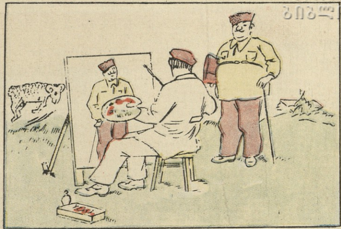
ფერმის გამგის სიაგარვე რომ ნათელი გაეხადა, მხატვარს სურდა ფერმის გამგე ნატურიდან დაეხატა,

მუსიკალურ ინსტრუმენტთა სექციის სალაროსთან რიგი დადგა. მოითხოვდნენ ხელზე არსებული ჩეკების განაღდებას. მოლარე განცვიფრებული შესცქეროდა მათ. მან არაფერი იცოდა რადიომიმღებ „მირ“-ის მოტანის შესახებ. ეს არც სექციის გამგემ იცოდა, არც მთავარმა ადმინისტრატორმა. წარმოიდგინეთ, არც დირექტორმა, რადგან... რადგან არც