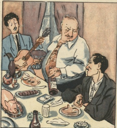
წმ. ირ. ვარდელაძის

— ახალი წლის პირველი დღეა და შევსება, ჯერ ახალი კრიტიკისა და ახალი რევიზიებისათვის არავის სცალაო!