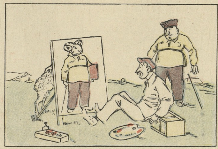
მაგრამ მოხდა სასწაული, მხატვარს ტილო გაეხა და ფერმის გამგის სიაგარვეს თითქოს ფარდაც აეხადა! კუჩხა-ბედნიერი

იმ დღეს და არც ახლო დღეებში უნივერსალი არ ელოდა „მირ“-ის ტიპის რადიომიმღებებს.