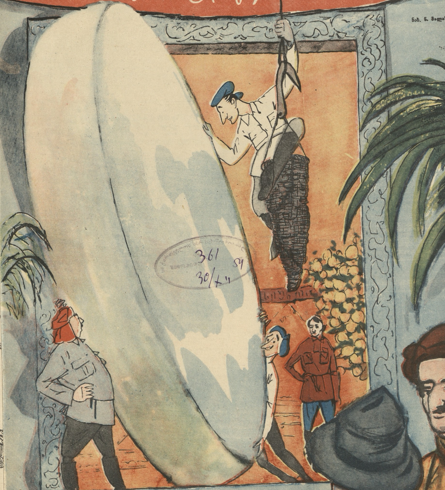
მახარაძის რაიონის სასოფლო-სამეურნეო გამოფენაზე მრავალ საუკეთესო ექსპონატს შორის წარმოდგენილი იყო 60-კილოგრამიანი სულგუნი, რომლის შესატანად საჭირო გახდა კარების ჩამოღება.

გამოფენა დაამზვენა, დახეთ ერთი, რა ყველია! ჩვენი სოფლის სიუხვის და შრომის გამომხატველია!