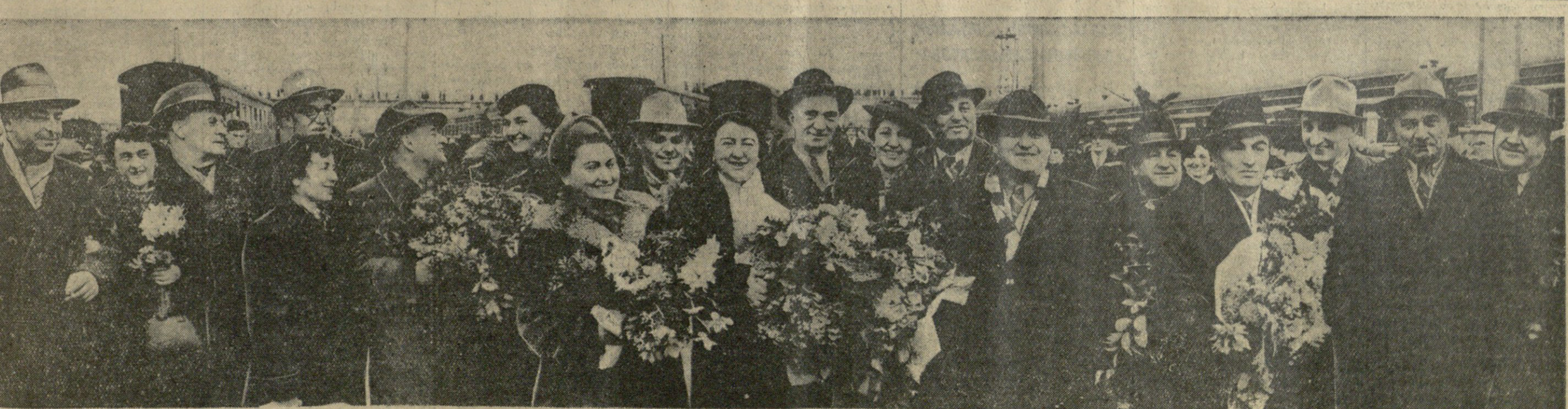
ქართული ხელოვნებისა და ლიტერატურის დეკადის მონაწილეთა ერთი ჯგუფი თბილისის ვაგზალზე.