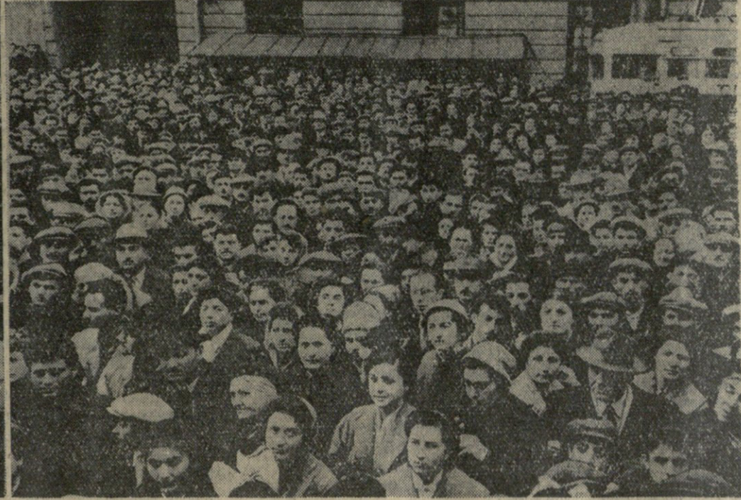
მიტინგი ქართული ხელოვნებისა და ლიტერატურის დეკადის მონაწილეთა დაბრუნების გამო. სიტყვით გამოდის საქართველოს კომუნისტური პარტიის მდივანი აბ. გ. გეგეშიძე.