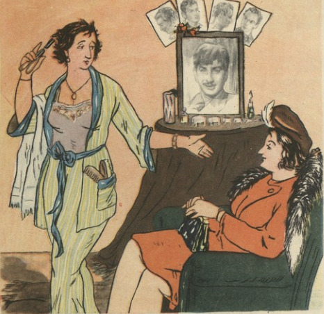
წმ. ივ. გორდელისა

— კმაყოფილი ხარ შენი ბედით, რუსეთო! როგორია შენი ქმაია? — შესანიშნავი მაღალი მღვთარგობა აქვს, კარგი ბინა, რიგის ვეფხე, „პოხილა“ ხაკუთა და მიწის ნაკვეთი წყნეთში... — ი, ი მაგარი, თვითონ, თვითონ როგორია? — იხე, ჩაი..