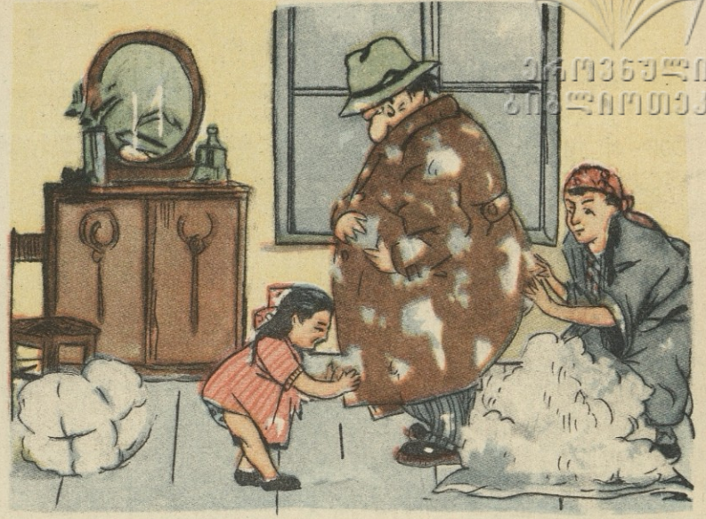
სურდა ოჯახი გაეხარებინა. დაინახა თუ არა, რომ წერტილში ბამბას ჰყიდიან — გაბრიელი იმწამშივე რიგში ჩადგა...