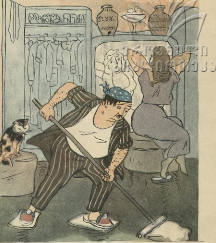
— სახსარული რა კარგად ვკრძობთ თავს, დაუთხავად კანს ვერავინ შემოაღებს. ჩვენ უფროსი კაცი არაა... შენ კი, შენ დახვეწების დღესაც ვერ დახვეწები... ცოლად ანა, ზან-მასეს და ბიურკუჩას შეამახდენი..