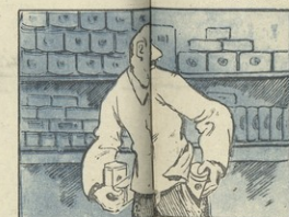
„...და კალი მელიქიძის...“

„ზოგიერთი მწერლის წარმოდგენით ეს კალი... კრისტა-დემოთი ყოფილა. მხატვრობა მანკავენ დასატა ამ ლექსის ოლუსტაკაცია აღნიშნულ მწერანთა წარმოდგენის მხედვით.“