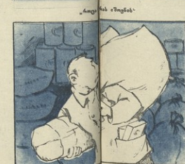
„...და კალი მელიქიძის...“