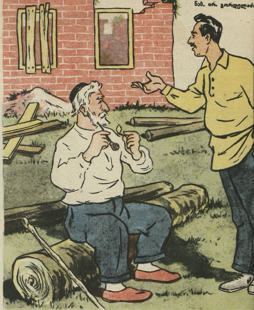
ნახ. გ. ლოდუასი