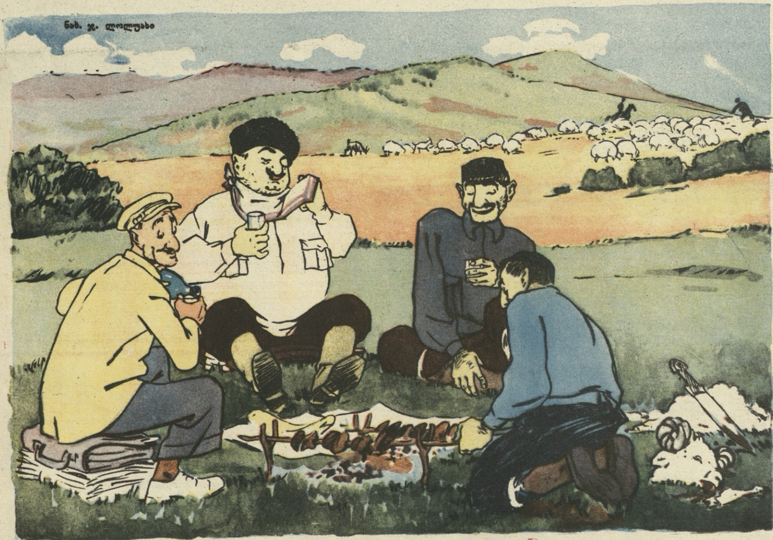
ნახ. ვ. დოღუაძისა

„თვისა ხამწყხოსა ცხვართათვის სიხსლისა დამაქციველი“. (ღ. გურამიშვილი)