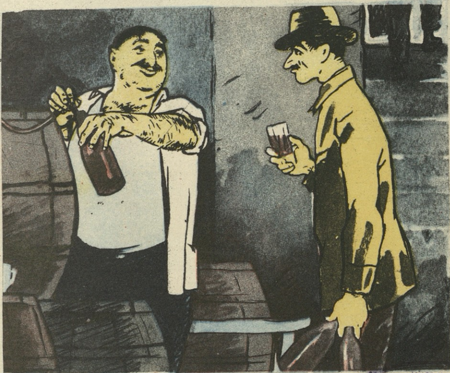
„ოდეს მასწავლათ მოსწყურდების, მაშინ წყალი ღვინოდ ღირსა“.