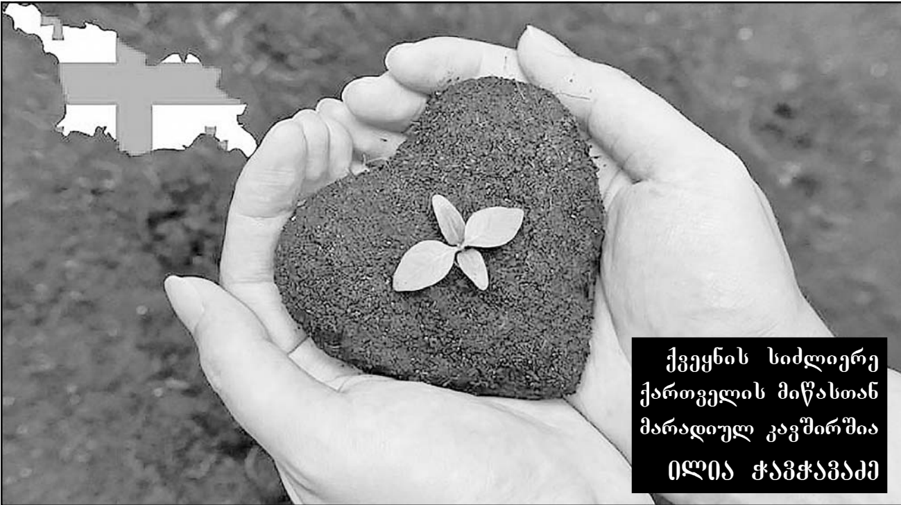
ქვეყნის სიძლიერე ქართველის მიწასთან მარადიულ კავშირშია ილია ჭავჭავაძე