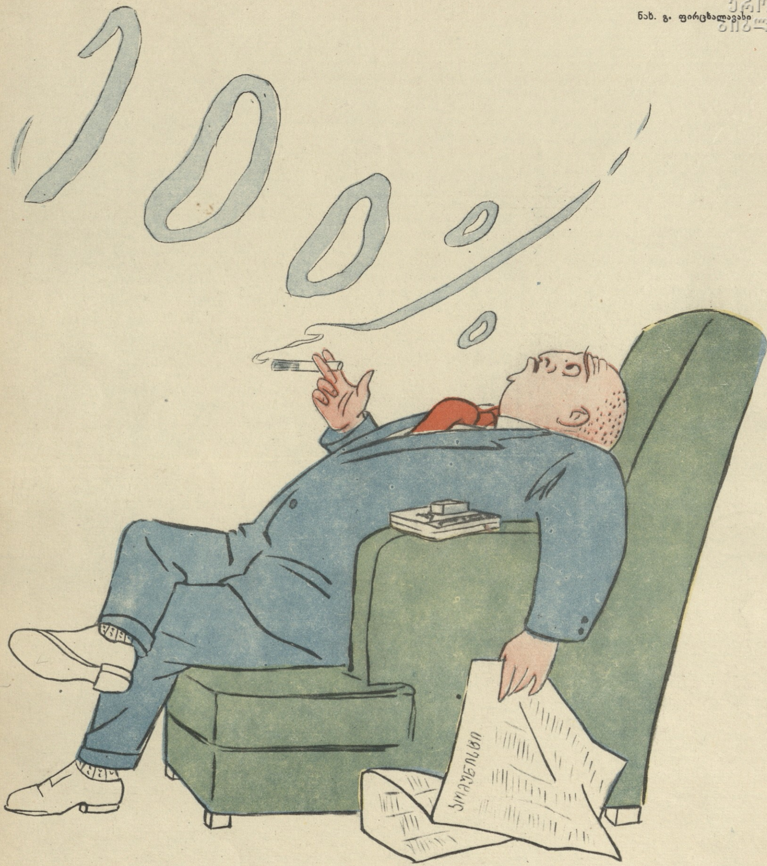
ჩამორჩენილი დირექტორის კვარტალური ოცნება