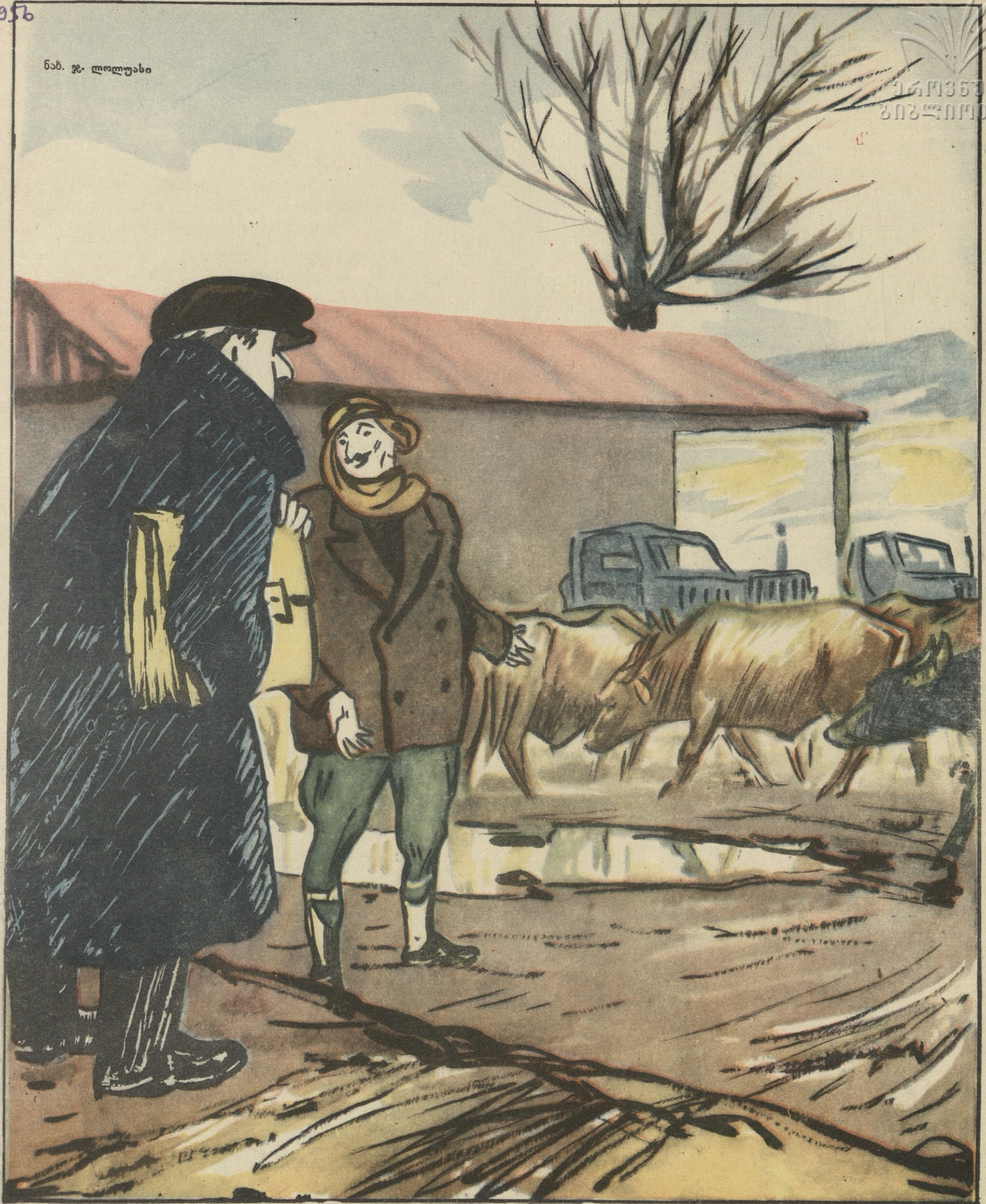
— უკაცრავად, აქ მტს-ი მეგულებოდა და ფერმაში კი მოვხვდი... — არ შემცდარხართ, სწორედ მტს-ია. ჩვენმა დირექტორმა სიფრთხილედ იხმარა და ხარ-კამეჩი. მორეკა: ტრაქტორი რომ ჩაგვივარდეს, ერთი უღელი რას ამოათრევს!