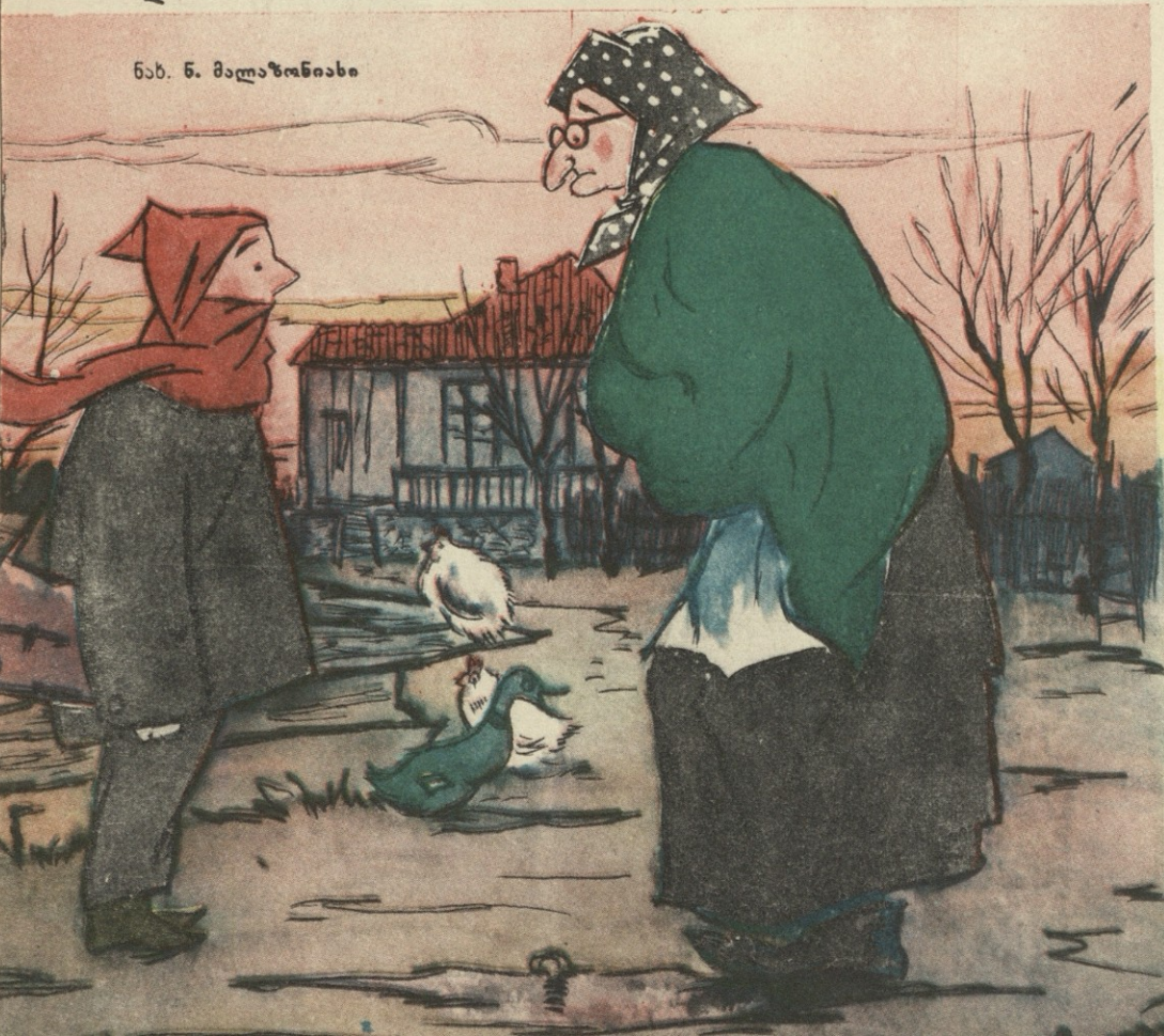
ნახ. ნ. მაღაზონიასი

ახალციხის ქვანახშირის მაღაროებში მექანიზმების მოვლას ყურადღება არ ექცევა: ნანგრევებში დამარხულია მრავალი საჭირო ხელსაწყო და დეტალი.