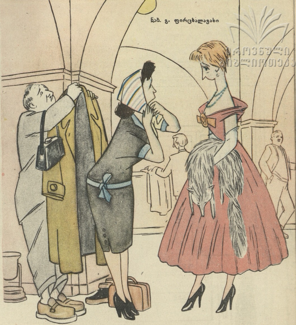
რუსთაველის თეატრში „ოიდიპოს მეფე“ უანტრაქტოდ მიდის.

— როგორ მოგეწონა სპექტაკლი? — ეს რა სპექტაკლია, ახალი კაბის ჩვენება ვერ მოვასწარი!