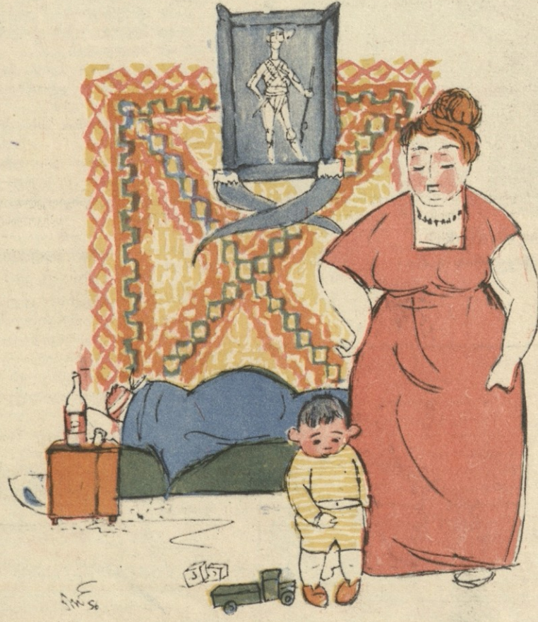
ნახ. ნ. მალაზონიასი

— დედიკო, რა არის კრიტიკა? — კრიტიკა, შვილო... აი, შენ რომ მამას უთხრა — ლოთი ხარო და მამამ გარეთ გამოგვადოს!..