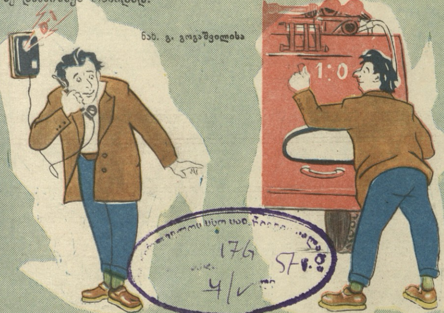
ნახ. გ. გაბაშვილისა