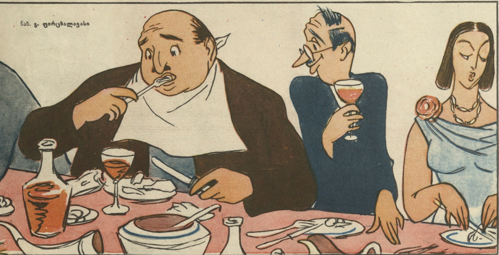
ნან. გ. ფირცხალავასი