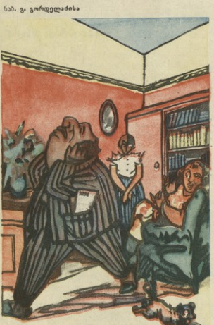
ზიის ღლიი თვალბი პასი

— იცი, ჩემო ძვირფასო, ჩვენს მალენას ცნობილი კრატეკისი თხოვლობის... — ვაიმე, ხალხიც კრატეკია?