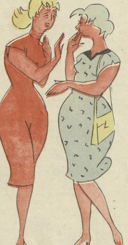
ნან. ა. ამაშუკელას

— იმეო, გუშინ ვინმე სივარულად ახახნა. — არ ენლო, ვაგო, ეს ხომ ამინდს ხუროში შეუთახს.