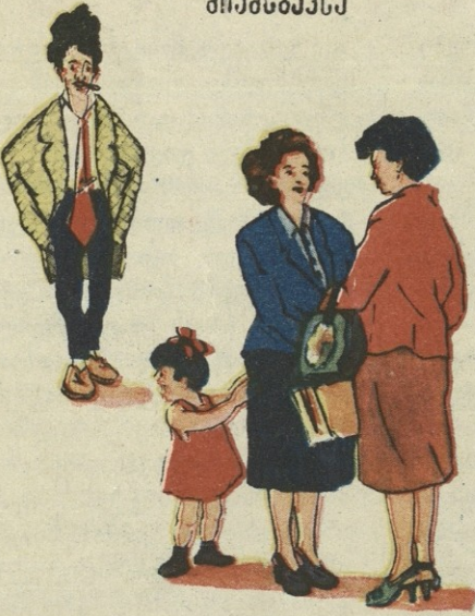
დედა, ბუა მოდიხის!..