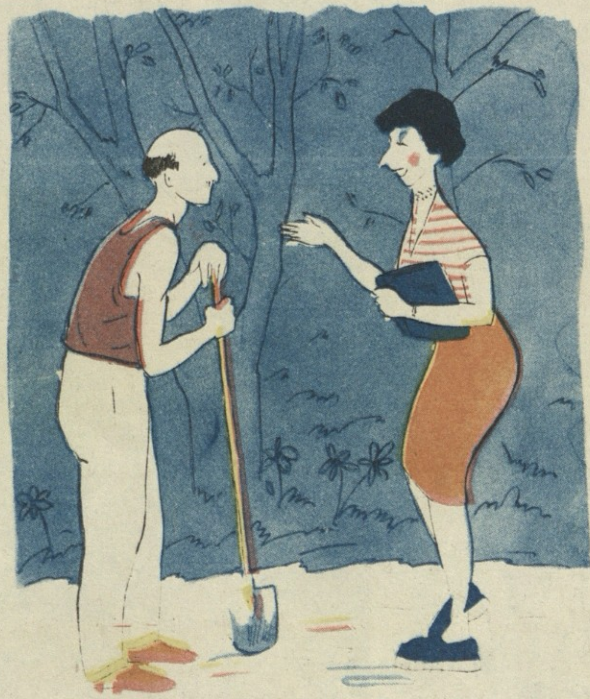
ნახ. თ. გიგაურისა