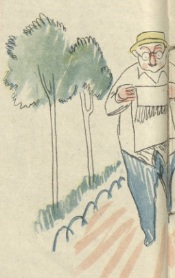
ნან. დ. ხორთაძის

— დედა, ეს რა ვაბე? კაცი მოდის! — უა, შენ კი ვინაზე, ჩემო ვნატატეკა ბაბი!