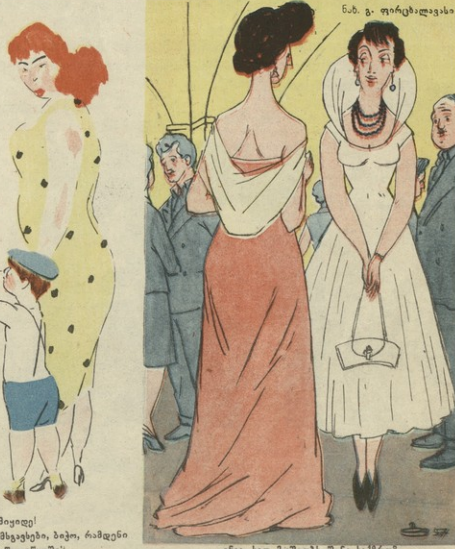
ნან. ზ. ნავარძიას

— ანა, ხალ მუშაობს შენი საქმრო? — რამბე?