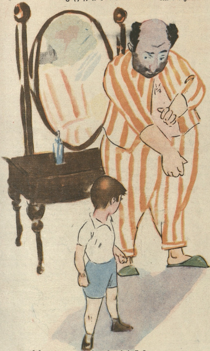
— მაშეკო, აკი დამპირდი პიჟამოს შენც გიყიდიო. — მოიცა, შვილო, ერთხელ გავრეცხავ და სწორედ შენი ზომისა ვახდება.