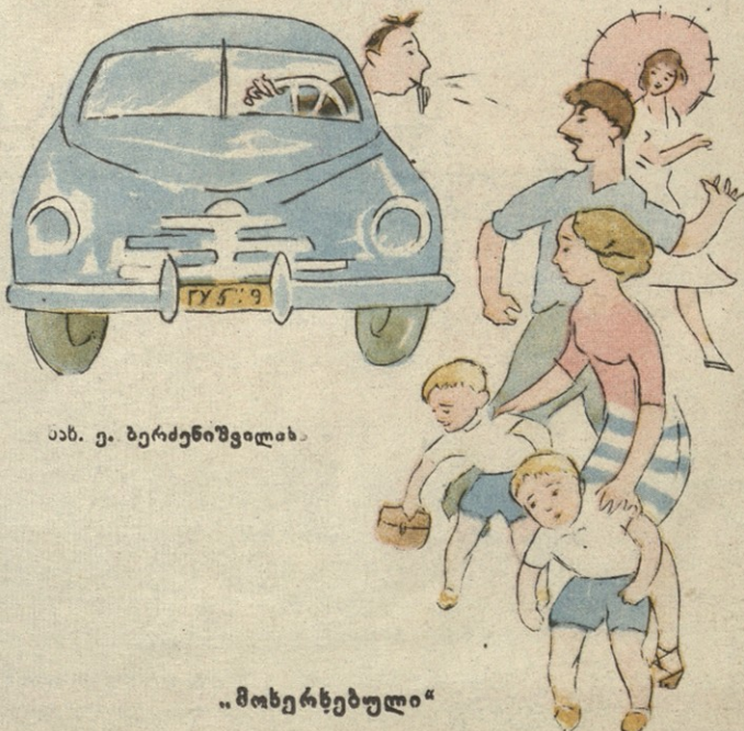
ნახ. ე. ბერძენიშვილისა