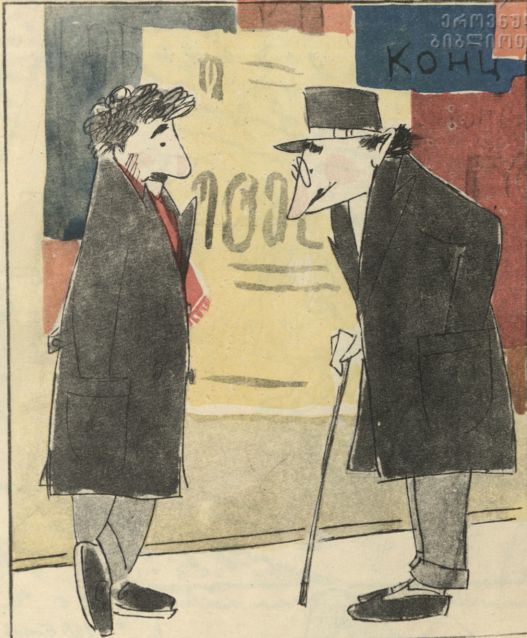
— რა ქენი, ამბაკო, ბალეტი „ოტელო“ ნახე? — კი ვნახე, ძამა, და მართალი გითხრა, რაც შავან თავის ცოლს უქნა, მერე თუ იცეკვებდა, აღარ მეგონა.

კოსმიური სამყაროს სატრანსპორტო სამმართველო თბილისის მძღოლთა საყურადღებოდ აცხადებს: დედამიწაზე საყვირის მიცემა აკრძალულია.