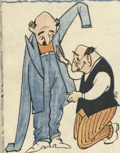
სამკერვალო ფაბრიკის (სულ ერთია რი- გელი) დირექტორის ასეთი კონტოში შეუ- კერონ