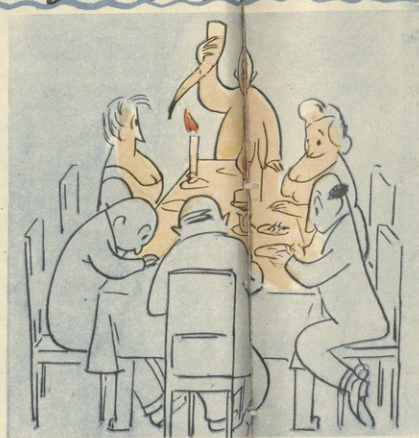
თელავის უფროს სახლში წავალე- ბის დროს ხინათლე კაბის