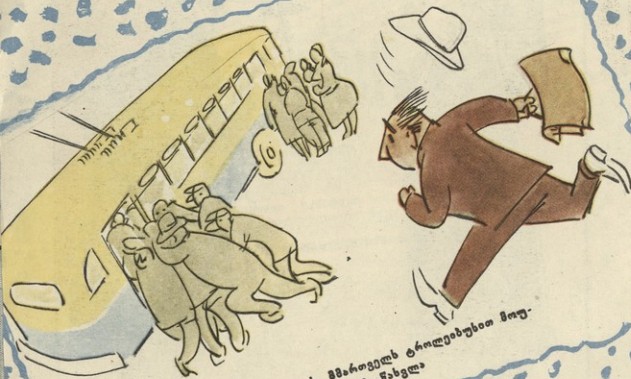
ბ. ბ. შაბაძის ტრამვაებზე მოუ- ხდეს ხანაბურში წახვლა