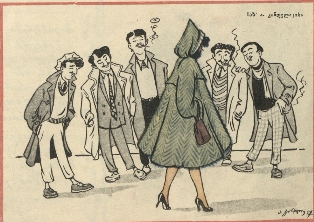
რუსთაველის პროსპექტზე მთარული ნაძვისხე