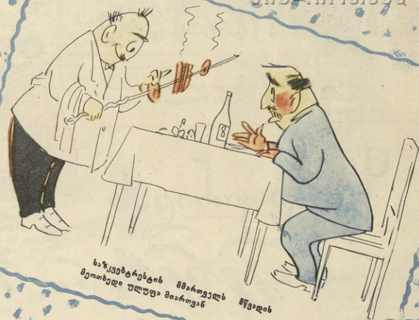
საწვევებზე ტრეტის შაბაძის მეიოზედ ულუფა მაართავნ წვალის