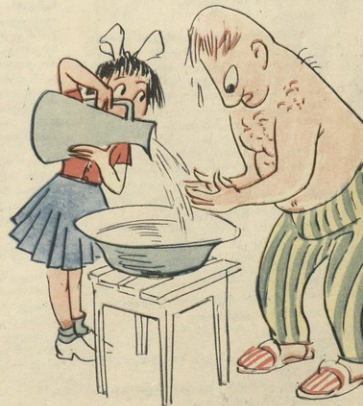
თბილწალახანდნის ტრეტის შაბაძის პირის ხანის დროს წვალი შეუწავადინ.