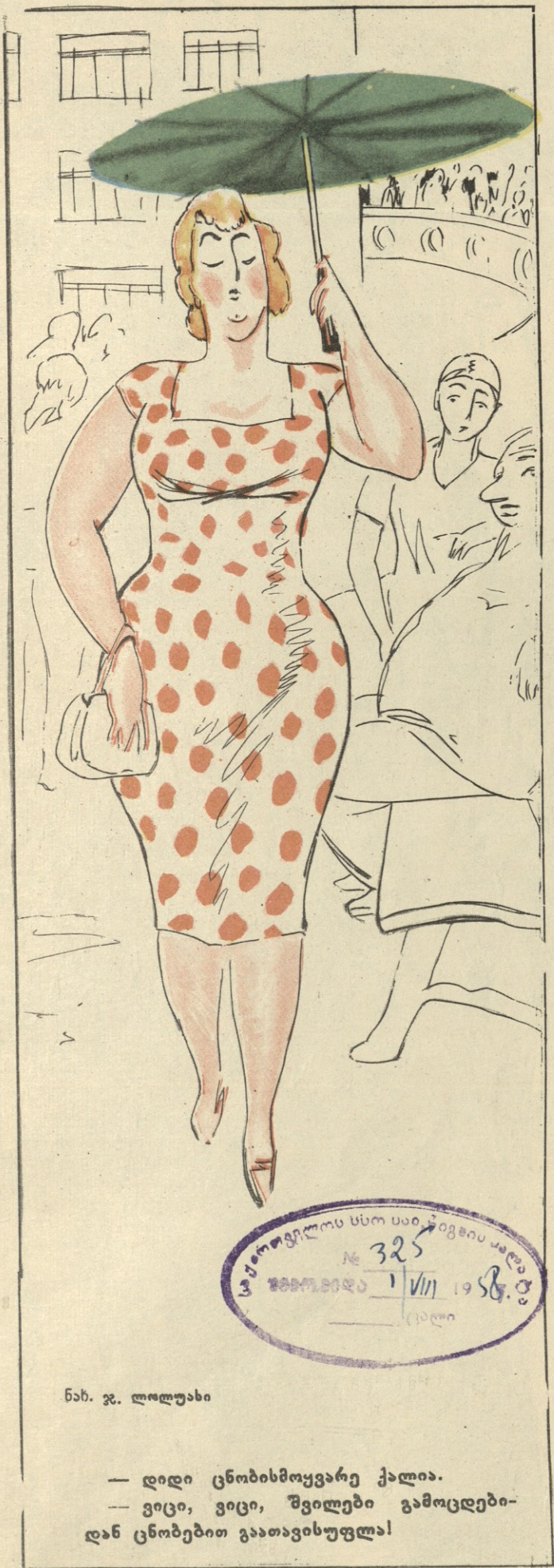
ნახ. ჯ. ლოლუაბი

— დიდი ცნობისმოყვარე ქალია. — ვიცი, ვიცი, შვილები გამოცდებიდან ცნობებით გაათავისუფლდა!