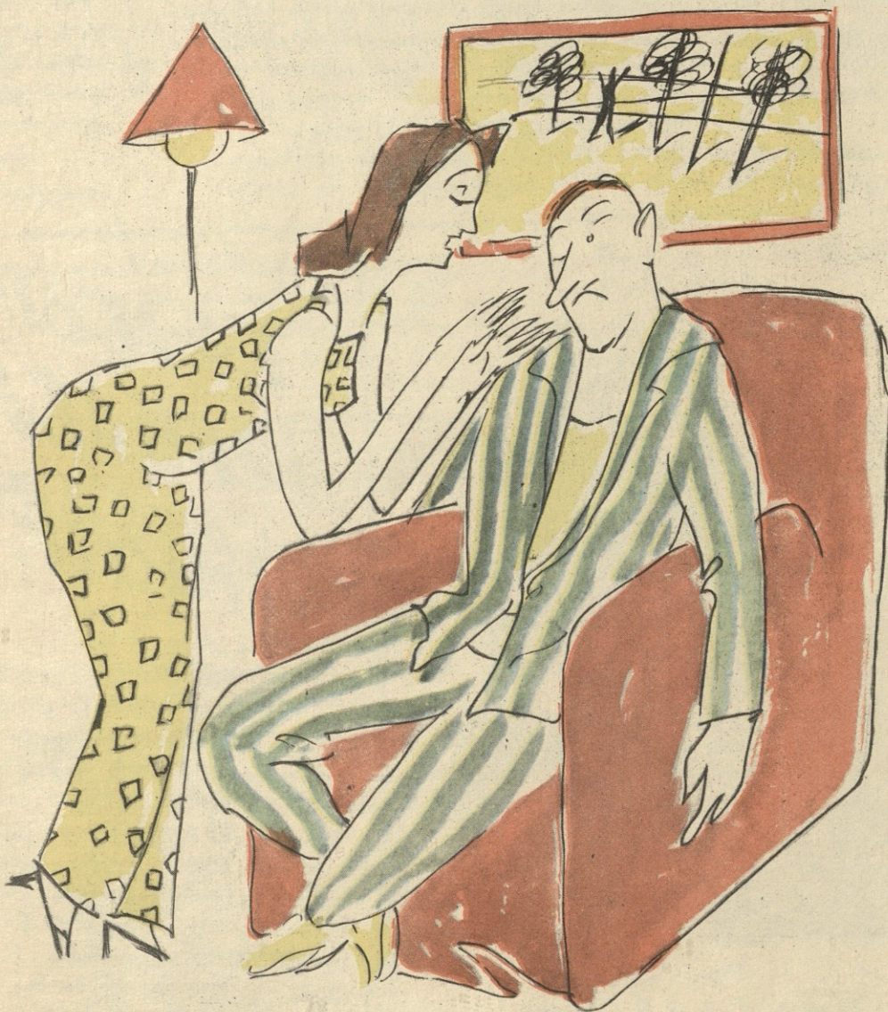
ნახ. ნ. მაღალნიასი

— შეყვარებულის როლებს სცენაზე რომ კარგად ასრულებ, ხახლში რაღა გემართება?