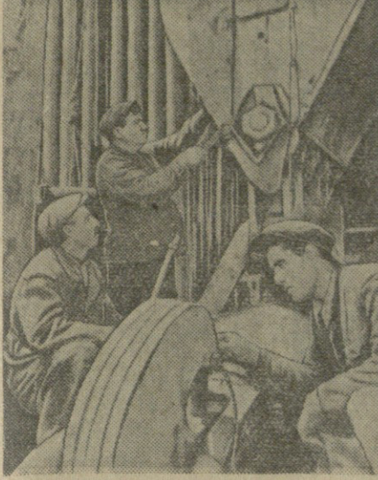
სურათში: კურჩუდ-ღის ნავთობმწვერავო მეგიდოვის მოწინავე ბრძოლა...

კურჩუთან ვა აზერბაიჯან რესპუბლიკა... ვადამდე რაგები... სანი ოთხი