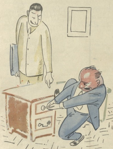
ნან. ჯ. დიმიტაძის