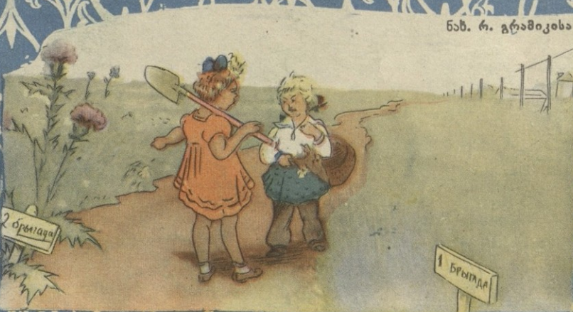
ნახ. რ. გრომისა

— აი, დღეაჩემის ნაკვიფრ რამდენი ევავილია, დღეაშენისაზე კი არა!