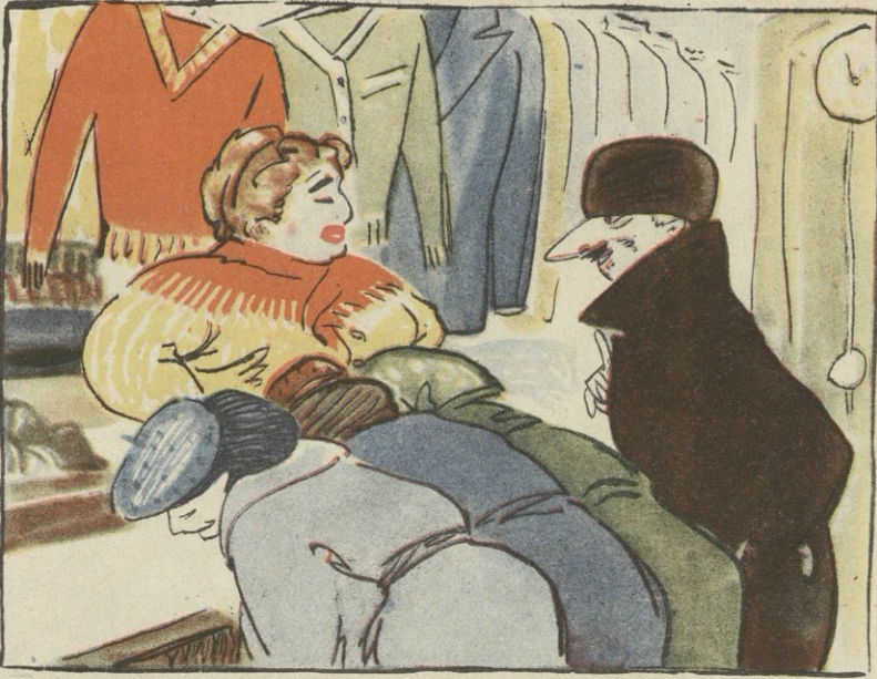
ნახ. გ. ლოლუასი — ერთი ნახმარი ნაძვის ხე გეგნებათ!

— ქალბატონო, მაშატიეთ, თქვენ ჩემ- თვის ხურდა არ მოგიციათ. — მიშატიებია.