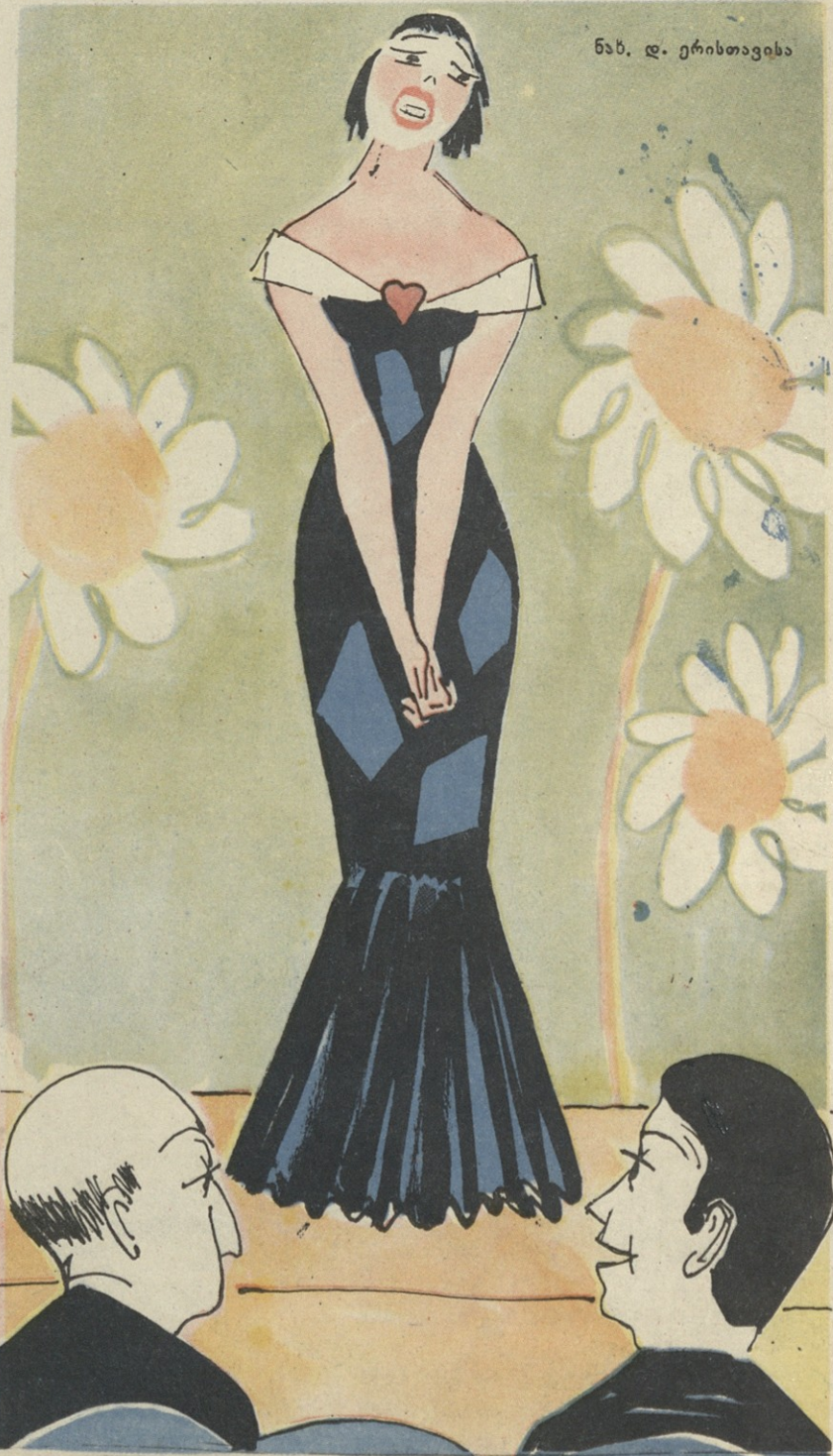
ნახ. დ. ერისთავისა

— რაა, ბოლოს და ბოლოს, ყოველ წელს სულ ერთსა და იმავე სიმღერას რომ მღერიან? — შე კმაყოფილი ვარ, წელს მომღერალი მაინც გამოუცვლიათ.