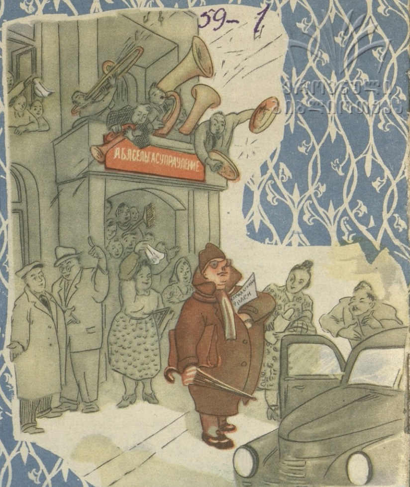
ნახ. რ. გრომისა

— მინდოდა გამოცხადებულიყო დღოთობის წინააღმდეგ, მაგრამ ენა არ შემოღწიილება.