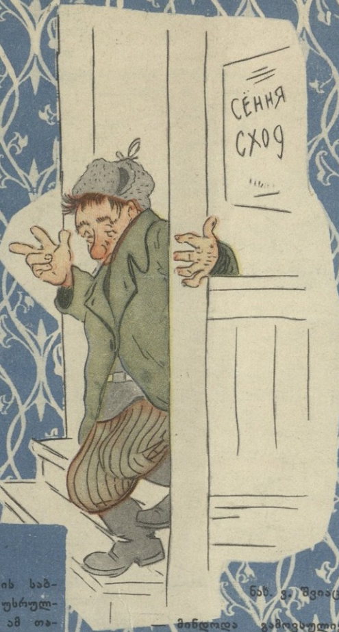
ნახ. ვ. შვიგალოვისა

1959 წლის 1 იანვარს ბელორუსიის საბჭოთა სოციალისტურ რესპუბლიკას უსრულდება 40 წელი. „ნიანგმა“ გადაწყვიტა ამ თარიღის აღსანიშნავად ბელორუსულ სატირულ-იუმორისტულ ჟურნალ „ვოლეკიდან“ შოთაფსის რამდენიმე კარიკატურა.