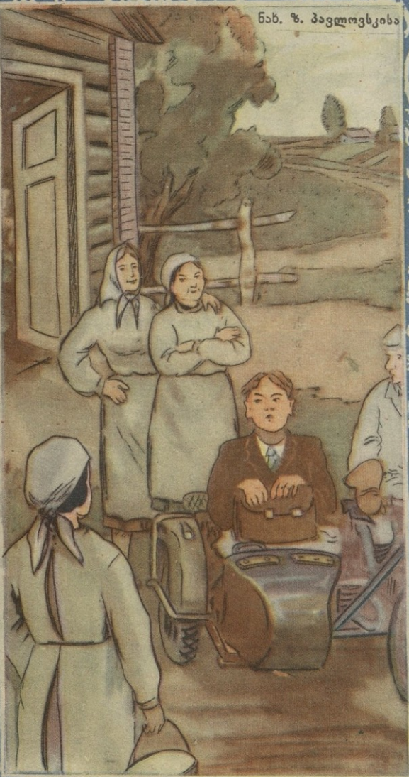
ნახ. ზ. პავლოვისა

— რაშია საქმე? — ვახსოვი არკადისებმ კოლმეურნეობის ნახვა გადაწყვიტა.