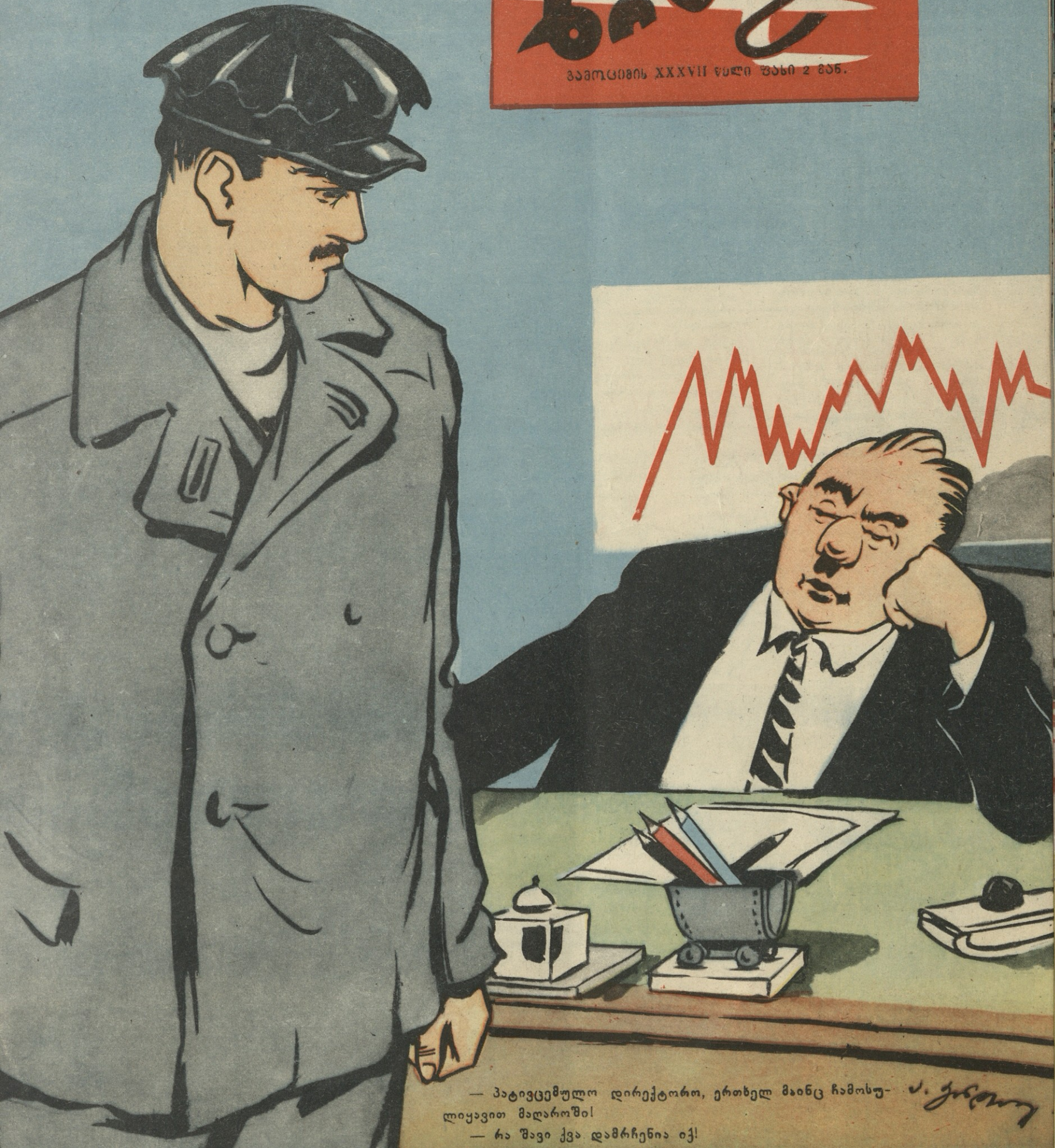
— პატივცემული დირექტორო, ერთხელ მაინც ჩამოსულიყავით მალაროში! — რა უავი ქვა დამრჩენია იქ!