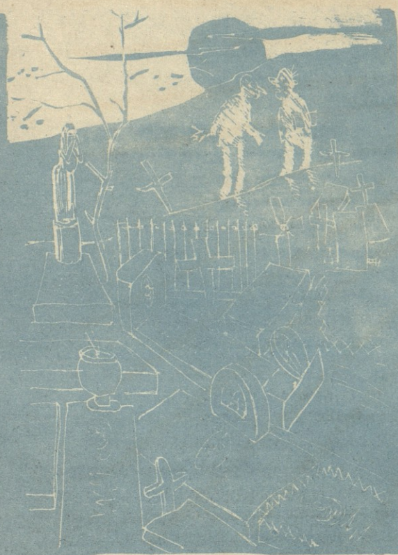
ნახ. ნ. მაღალაშვილისა