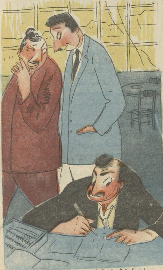
ნახ. რ. მახარაძისა

— რატომ არის ეს ადგილი ცარიელი? — თქვენთვის მაქვს შენახული, ბატონო.