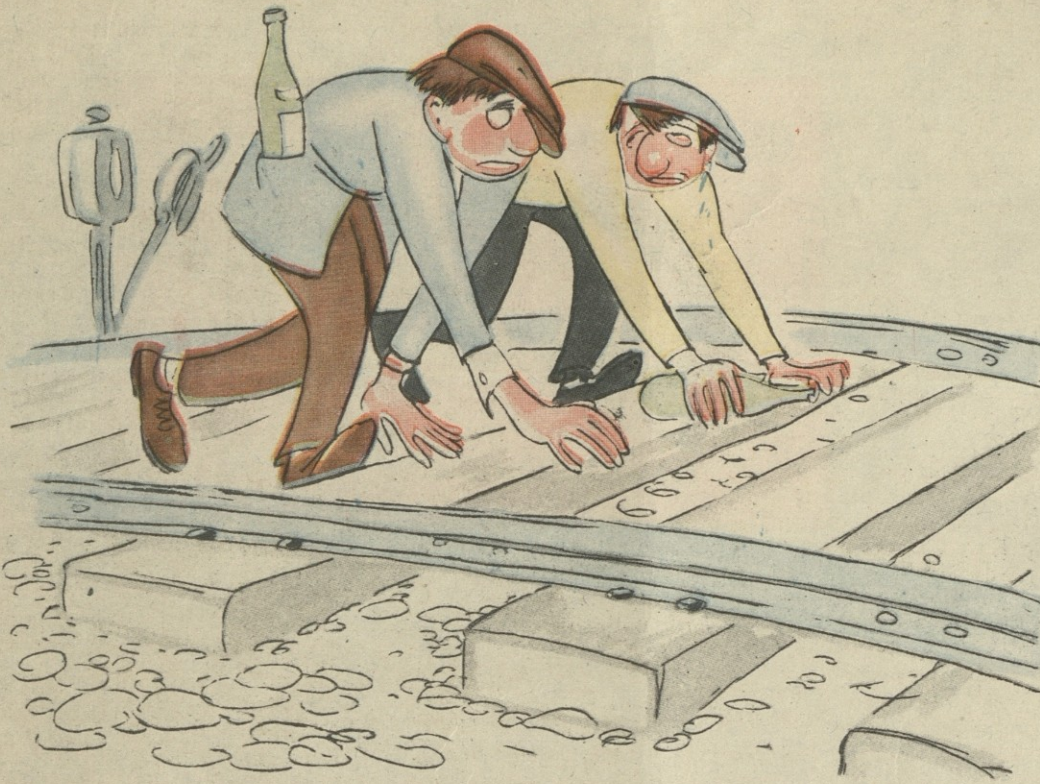
— თუ ძმა ხარ, რომელ სართულზე ცხოვრობ? —