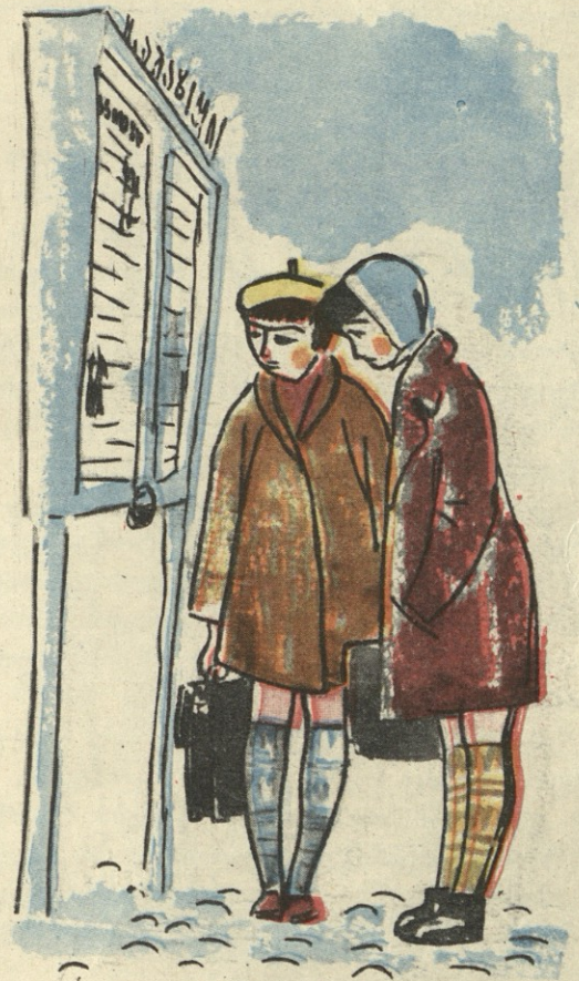
— თინიკო, რა ხაინტერესოა, შარშან პირველი მაისი ხუთშაბათს ყოფილა!