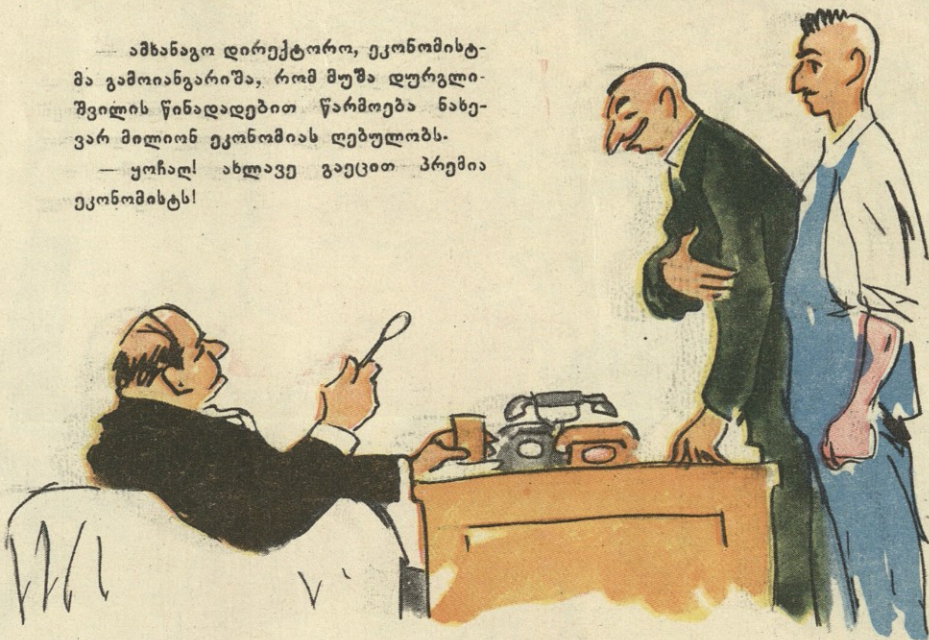
ნახ. ზ. ლეჟავასი

— ამხანაგო დირექტორო, ეკონომისტ-მა გამოიანგარიშა, რომ მუშა დურგლი-შვილის წინადადებით წარმოება ნახევარ მილიონ ეკონომიას ღებულობს. — უჩაღ! ახლავე გავეცით პრემია ეკონომისტს!