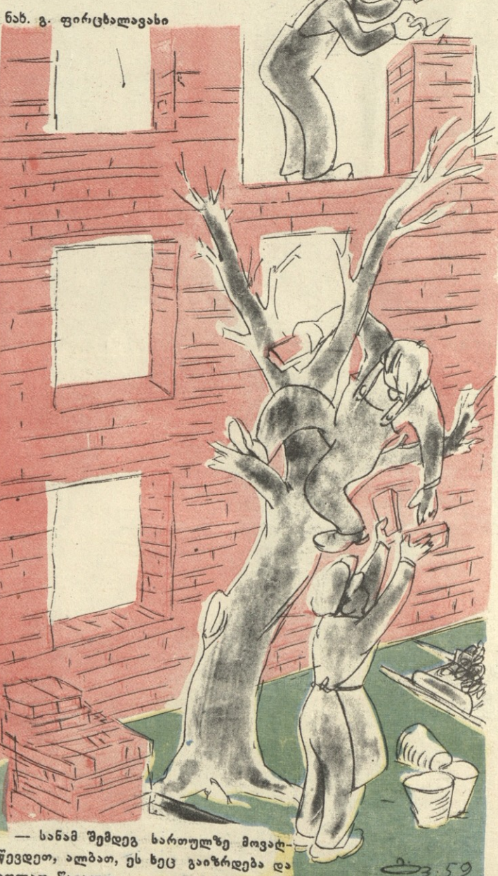
— სანამ შემდეგ ხართულზე მოვატ- წევდეთ, ალბათ, ეს ხეც გაიზრდება და იოლად წავალთ.