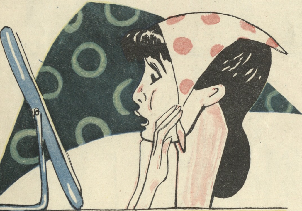
არტელ „გამარჯვების“ მიერ გამოშვებული ქალის თავსაფრები.