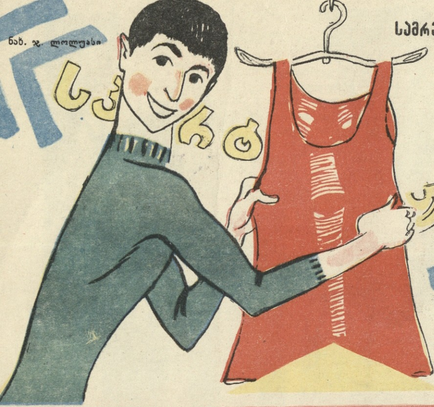
საქართველოს სარეწაო საბჭოს არტელ „სპორტრიკოტაჟის“ მიერ გამოშვებული მამაკაცის მაისურები.

ფართო მოხმარების საქონლის დამამზადებელი ზოგიერთი საწარმო უზარისხო პროდუქციას უშვებს.